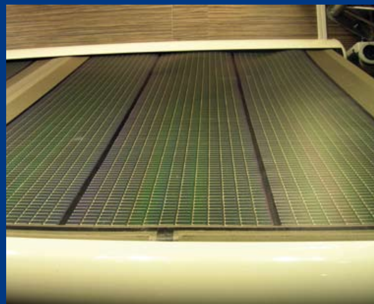
Un concept innovant : la toile de store solaire, conçue par Dickson, intègre des cellules photovoltaïques pour générer une énergie renouvelable. (Dickson-Constant)

Pour une protection maximale, choisissez le store coffre en aluminium où l'intégralité de votre structure (bras et toile) se replie dans un caisson de protection.