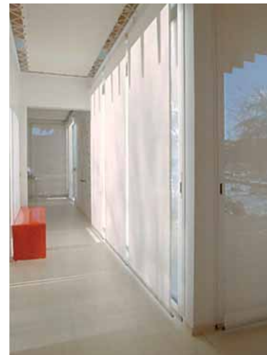
Photo : Soltis 86 de Ferrari

l'inconfort visuel. Les voilages peuvent eux aussi répondre à des exigences de confort et d'esthétisme. Pour créer une ambiance personnalisée et créative, ils n'ont pas leurs équivalents. Ils apportent transparence et légèreté aux fenêtres et baies vitrées, et préservent l'intimité sans assombrir l'ambiance. Cependant, pour contrôler les entrées de chaleur solaire, il sera judicieux de prévoir, en complément, des stores extérieurs ou intérieurs choisis à cet effet •