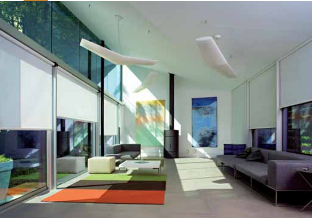
Les stores enrouleurs : Efficaces, fonctionnels et très contemporains. (Mariton)

Les stores enrouleurs, connus pour leur fonctionnalité, offrent une protection efficace contre la chaleur et pour occulter une fenêtre. D'un point de vue décoratif, une large gamme de matières, de textures et de coloris les a rendu plus agréables à l'œil, et faciles à harmoniser avec un intérieur contemporain. Dickson crée SUNWORKER®, la toile de store « nouvelle génération » spécialement conçue pour les architectures modernes aux grandes surfaces vitrées. Ces Textiles « intelligents » sont réputés filtrer 94% de la chaleur. Ils sont composés de fils polyester haute ténacité enduits PVC, et sont tissés de façon à leur conférer une haute résistance aux agressions climatiques et aux déchirures. Permettant de voir sans être vus, ces tissus offrent également une grande facilité d'entretien.