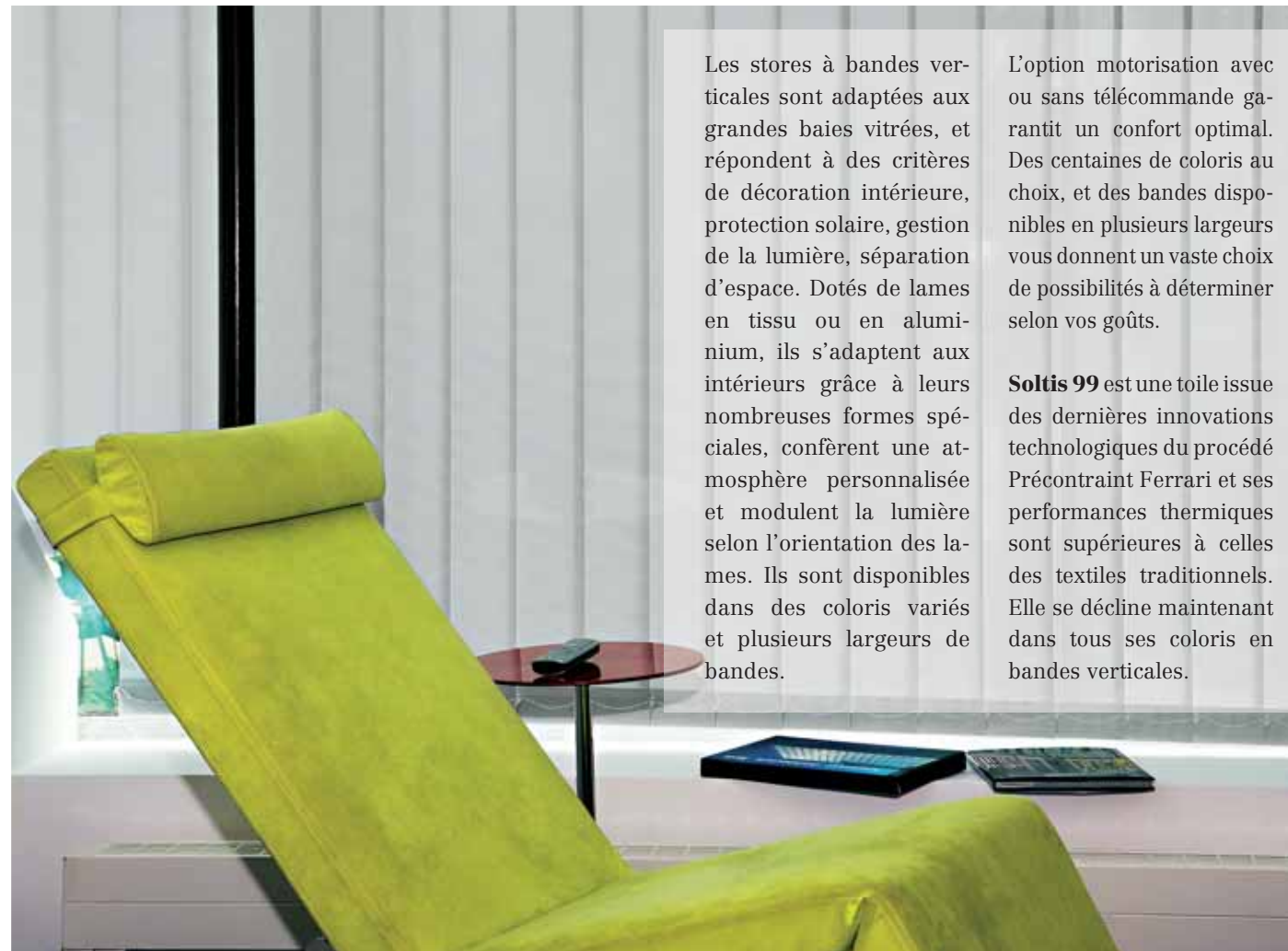
Les stores à bandes verticales sont parfaits pour les grandes baies vitrées. (Mariton)

Les stores à bandes verticales sont adaptées aux grandes baies vitrées, et répondent à des critères de décoration intérieure, protection solaire, gestion de la lumière, séparation d'espace. Dotés de lames en tissu ou en aluminium, ils s'adaptent aux intérieurs grâce à leurs nombreuses formes spéciales, confèrent une atmosphère personnalisée et modulent la lumière selon l'orientation des lames. Ils sont disponibles dans des coloris variés et plusieurs largeurs de bandes.