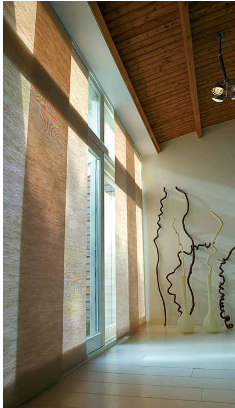
Panneau japonais. (Mariton)

Résolument tendance et idéal pour aménager de larges ouvertures, le panneau japonais se substitue facilement à une cloison pour créer des coins d'intimité et ajouter une touche zen. Son large choix de matières (coton, polyester ou screen) permet de créer des ambiances douces, chaleureuses ou contemporaines. La manœuvre s'effectue aisément par cordon ou par tringle.