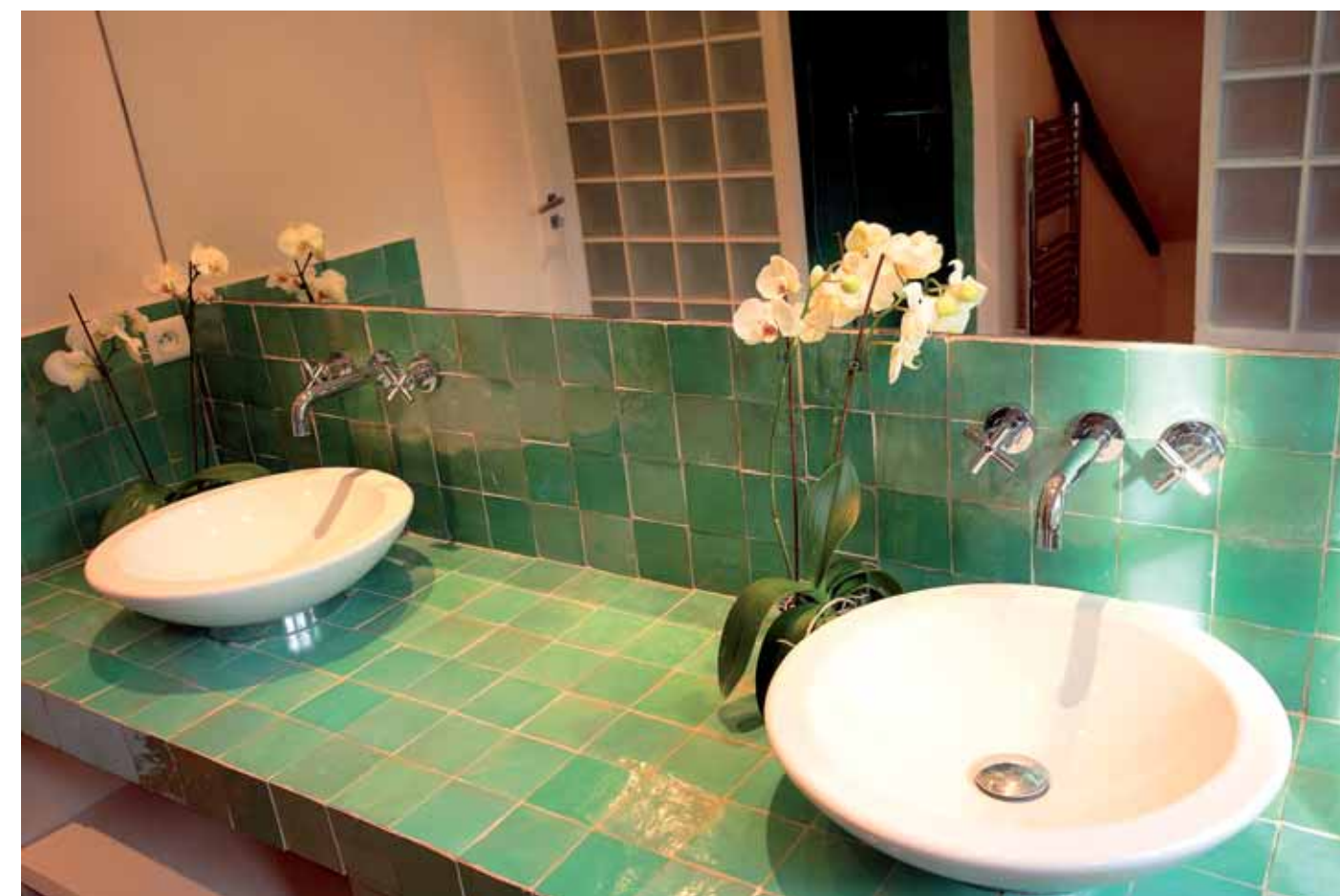
Le miroir qui s'étend sur toute la largeur permet d'agrandir cette salle de bains, équipée de parois en pavés de verre pour séparer douches et toilettes