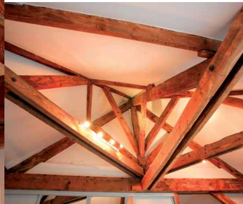
La charpente en chêne a été remise en apparence.

La salle de bains a été aménagée dans les combles. La charpente en chêne a été rénovée, tout comme le parquet qui a simplement été peint. L'étage de la maison comprend trois chambres dont deux avec salles de bains privées.