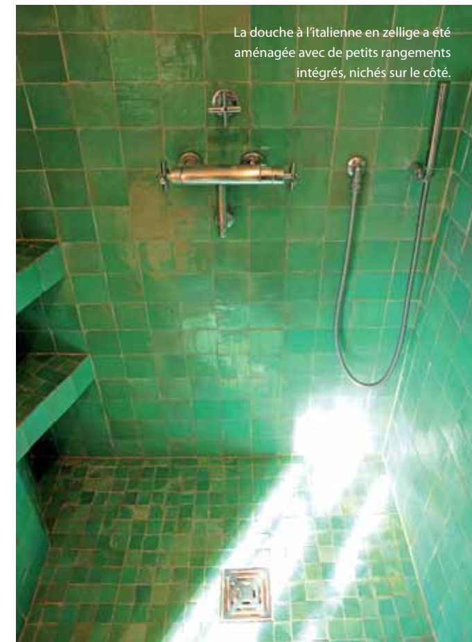
La douche à l'italienne en zellige a été aménagée avec de petits rangements intégrés, nichés sur le côté.