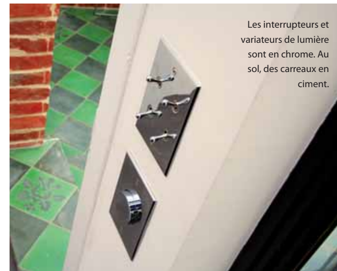
Les interrupteurs et variateurs de lumière sont en chrome. Au sol, des carreaux en ciment.

L'atelier (à gauche) et la maison sont reliés par une petite véranda dont les profilés en acier sont coordonnés à ceux des fenêtres, et aux soubassements en brique.