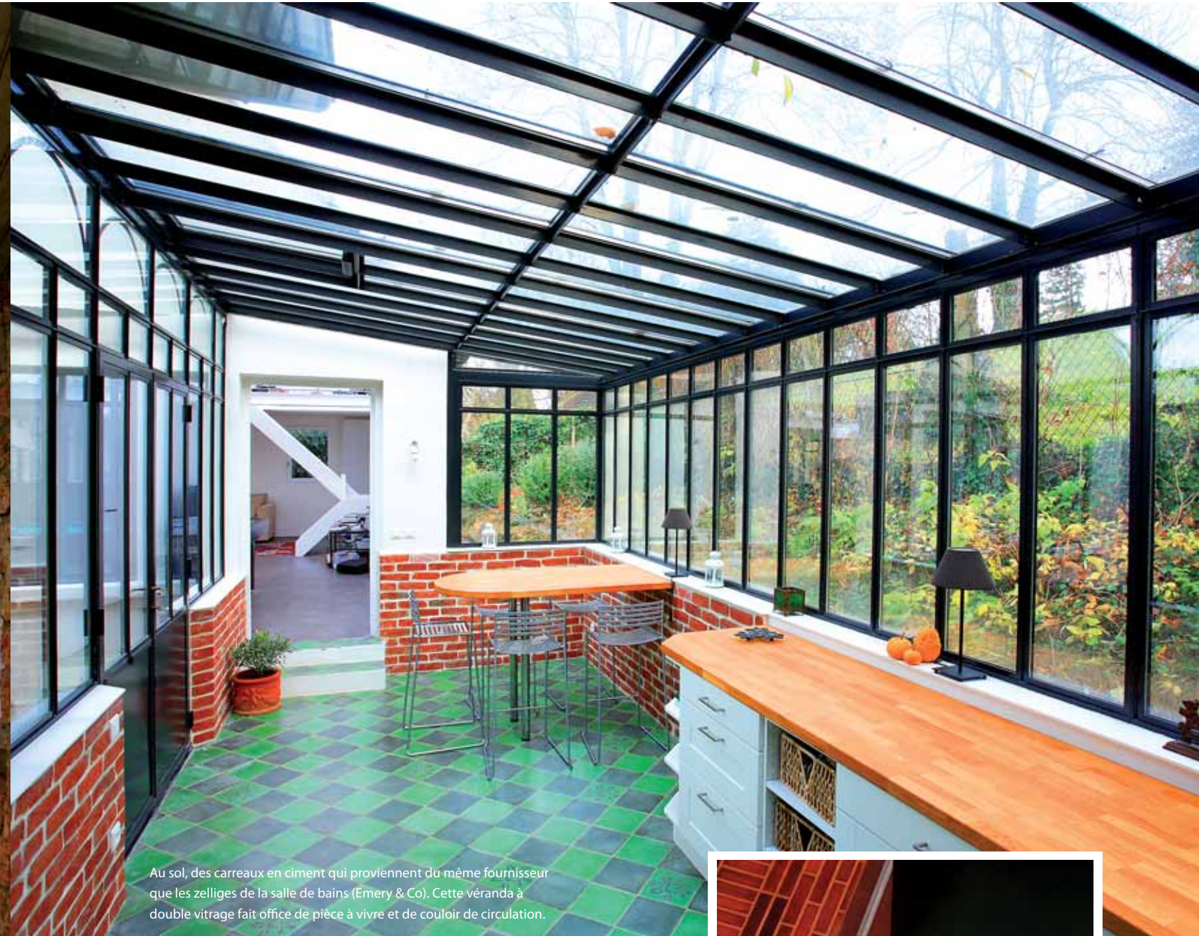
Au sol, des carreaux en ciment qui proviennent du même fournisseur que les zelliges de la salle de bains (Emery & Co). Cette véranda à double vitrage fait office de pièce à vivre et de couloir de circulation.