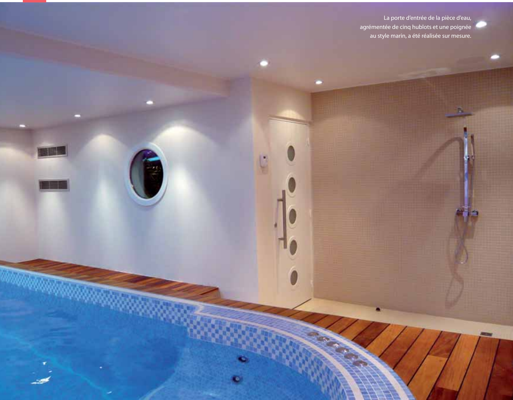
La porte d'entrée de la pièce d'eau, agrémentée de cinq hublots et une poignée au style marin, a été réalisée sur mesure.

C e projet, situé à Cormeilles en Parisis dans le Val d'Oise, consistait à intégrer spa de nage de 18 m 2 (6 mètres par 3) dans le sous-sol d'une maison individuelle. Avant travaux, l'espace était divisé en cinq pièces : la salle des machines (chaudière, etc.), deux pièces destinées au rangement (vélos, vins, bricolage, jardinage), le garage pouvant accueillir deux voitures et la buanderie.