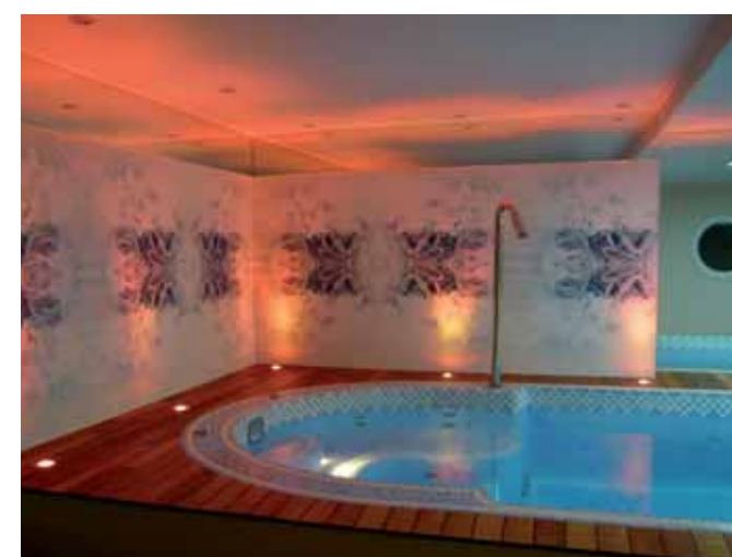
Un même lieu pour des ambiances lumineuses étonnantes !