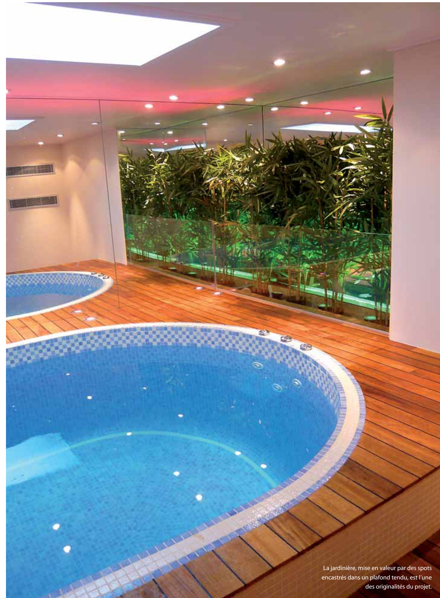
La jardinière, mise en valeur par des spots encastrés dans un plafond tendu, est l'une des originalités du projet.

été créé et un espace de vie aménagé sur l'estrade. Des enceintes ont été encastrées dans le faux plafond et la pièce insonorisée. Des matériaux de natures très différentes ont été choisis pour structurer l'espace et jouer avec les éléments : un parquet bateau pour son côté chaud, doux et marin, un papier peint sur mesure spécial extérieur de chez Paris-Gang pour dynamiser et moderniser la vision du projet.