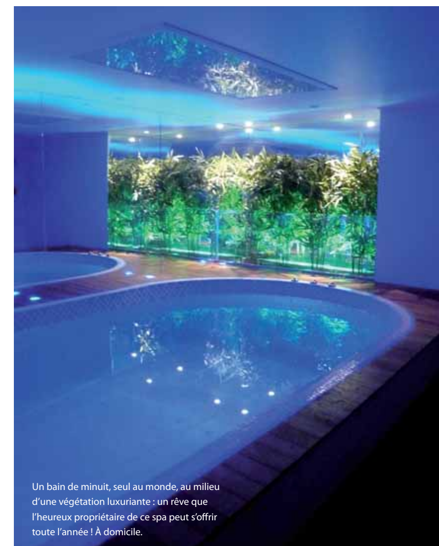
Un bain de minuit, seul au monde, au milieu d'une végétation luxuriante : un rêve que l'heureux propriétaire de ce spa peut s'offrir toute l'année ! À domicile.

Réalisation du projet Omeo Architecture d'intérieur 01, allée des érables 95390 St Prix www.omeo.fr