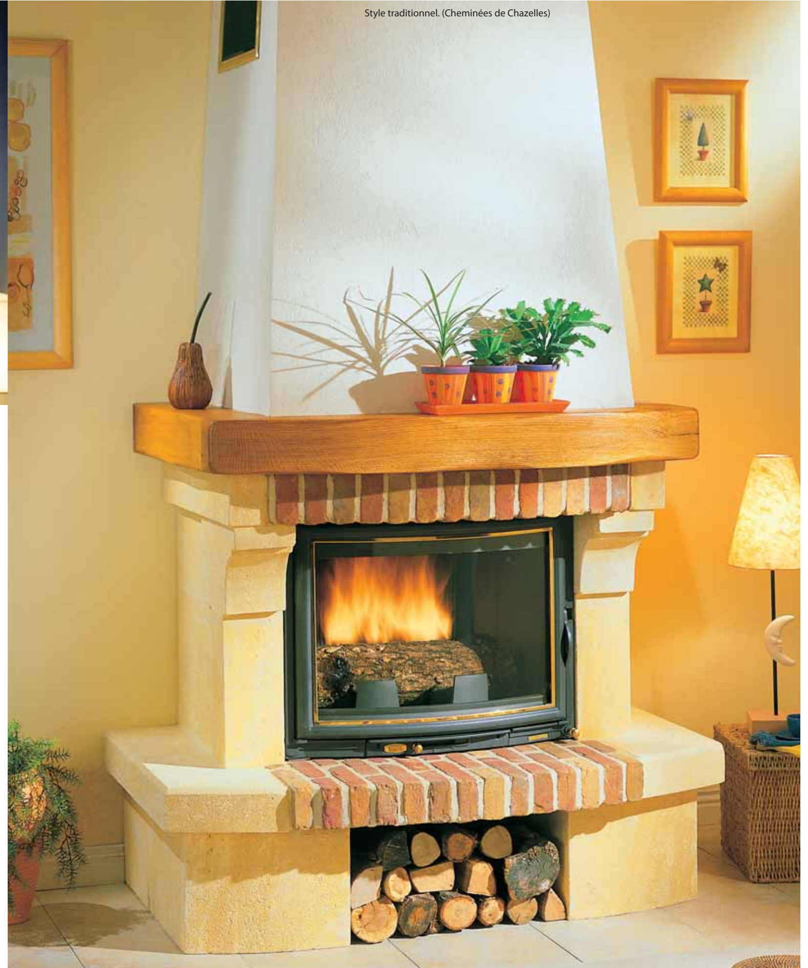
Style traditionnel. (Cheminées de Chazelles)

Cependant, beaucoup de clients sont à la recherche de cheminées modernes, adaptées à leur temps et surtout parfaitement intégrées à la maison et à sa décoration. C'est pourquoi la grande majorité des cheminées contemporaines sont faites sur-mesure.