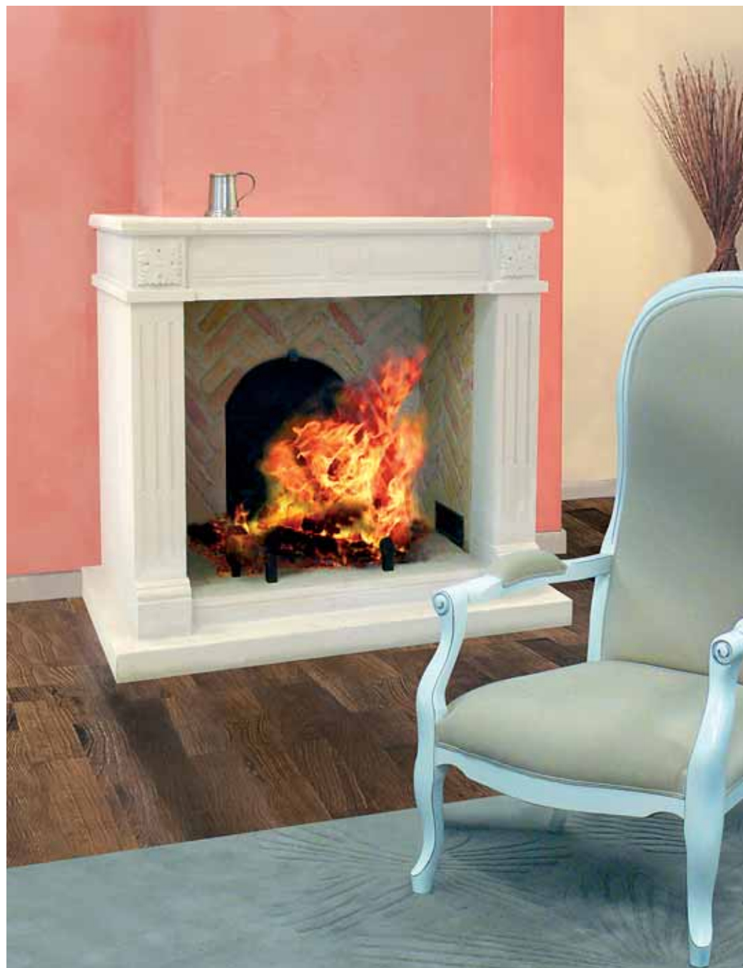
Foyer ouvert. Aristo, modèle en pierre de Richmond sculpté. (Atreo)

La facture toujours en augmentation des frais de chauffage et le souci d'économie d'énergie incitent de plus en plus d'occupants de maisons ou d'appartements qui possèdent d'anciennes cheminées à les remettre en service. Sauf qu'une cheminée ne diffuse que 20% de sa chaleur, le reste disparaissant avec la fumée.