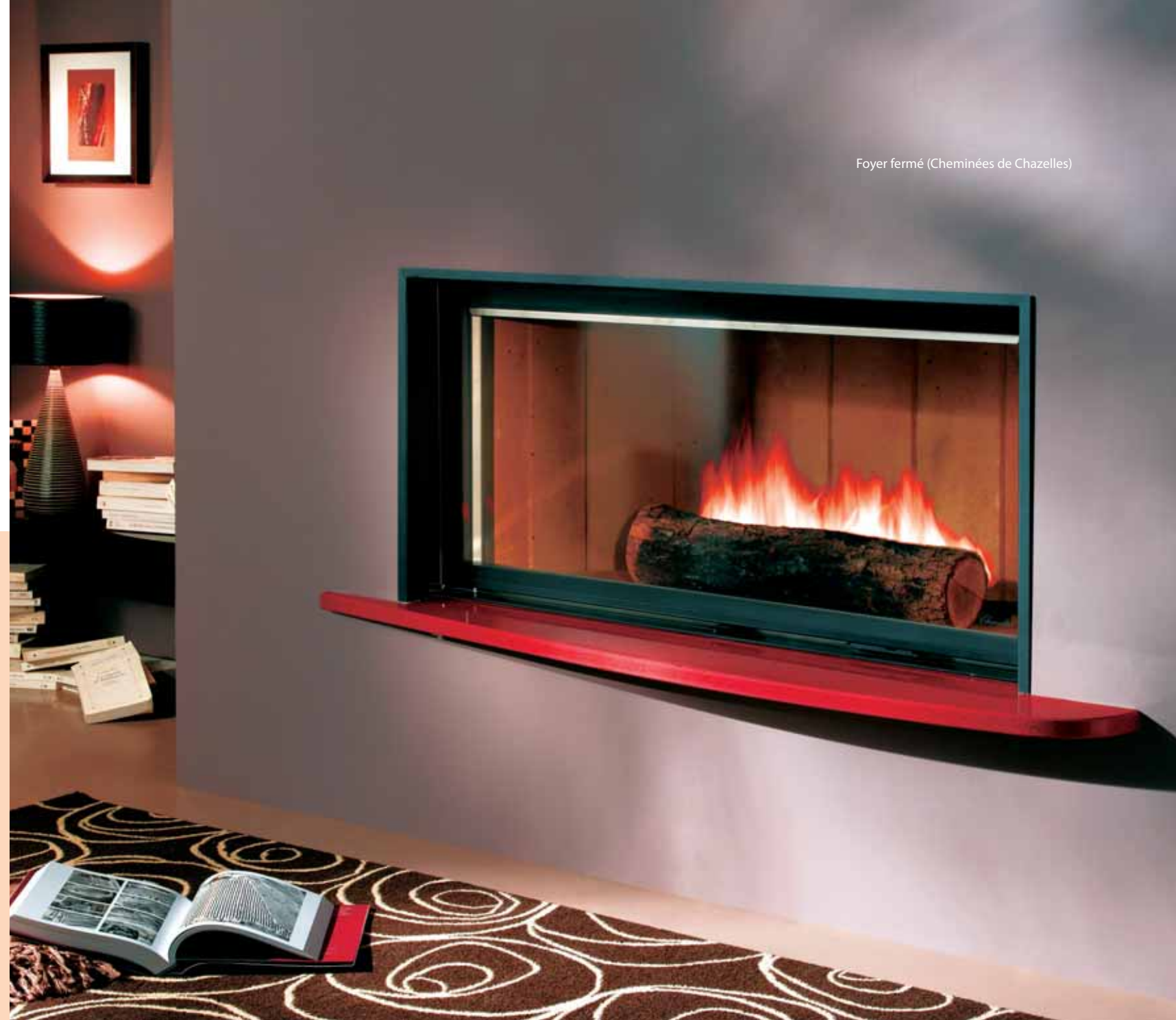
Foyer fermé (Cheminées de Chazelles)

Pour faire un apport significatif dans un système de chauffage, il faut fermer le foyer en installant un insert ou un foyer fermé. L'insert, qui peut être encastré dans une cheminée existante, chauffe la pièce dans laquelle il se trouve. À l'inverse, on construit la cheminée autour du foyer fermé, qui est posé soit sur l'âtre, soit sur une 'chaise' métallique (ou maçonnerie), de manière à laisser sous le foyer un passage de 600 cm 3 pour que l'air réchauffé par convection soit aspiré puis distribué dans les pièces avoisinantes. Un autre avantage est l'aspect sécurité. Un foyer fermé est la garantie qu'en cas de crépitements, aucune braise incandescente ne sera projetée dans la pièce. Sa consommation en bois est également largement inférieure à celle d'un foyer ouvert.