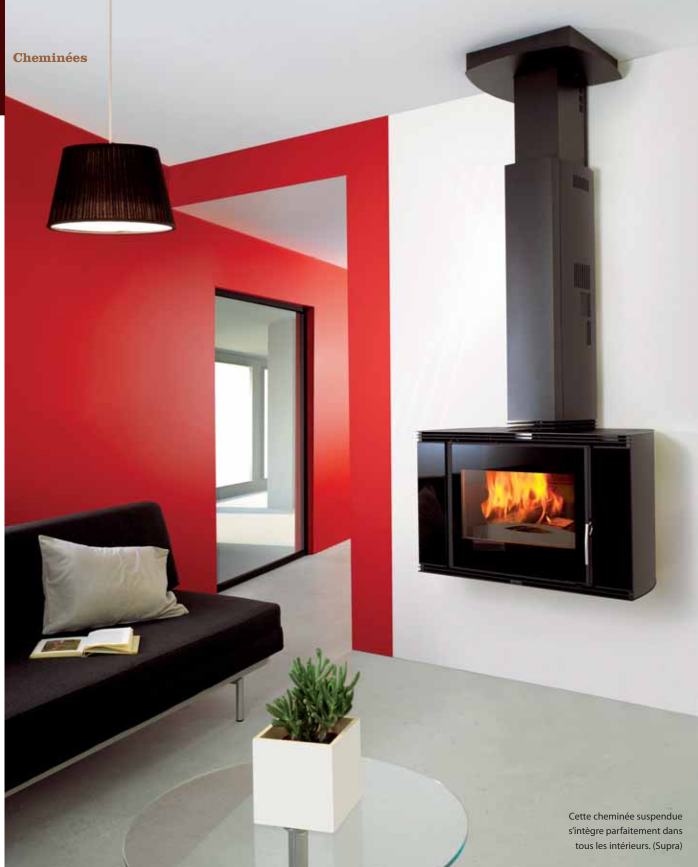
Cette cheminée suspendue s'intègre parfaitement dans tous les intérieurs. (Supra)

Les cheminées Focus, par exemple, peuvent s'adapter aux longueurs de conduits, aux pièces de raccordement et de fixation existantes. Elles peuvent ainsi s'intégrer à tous les types d'habitat. D'autres fabricants, comme Piros, créent