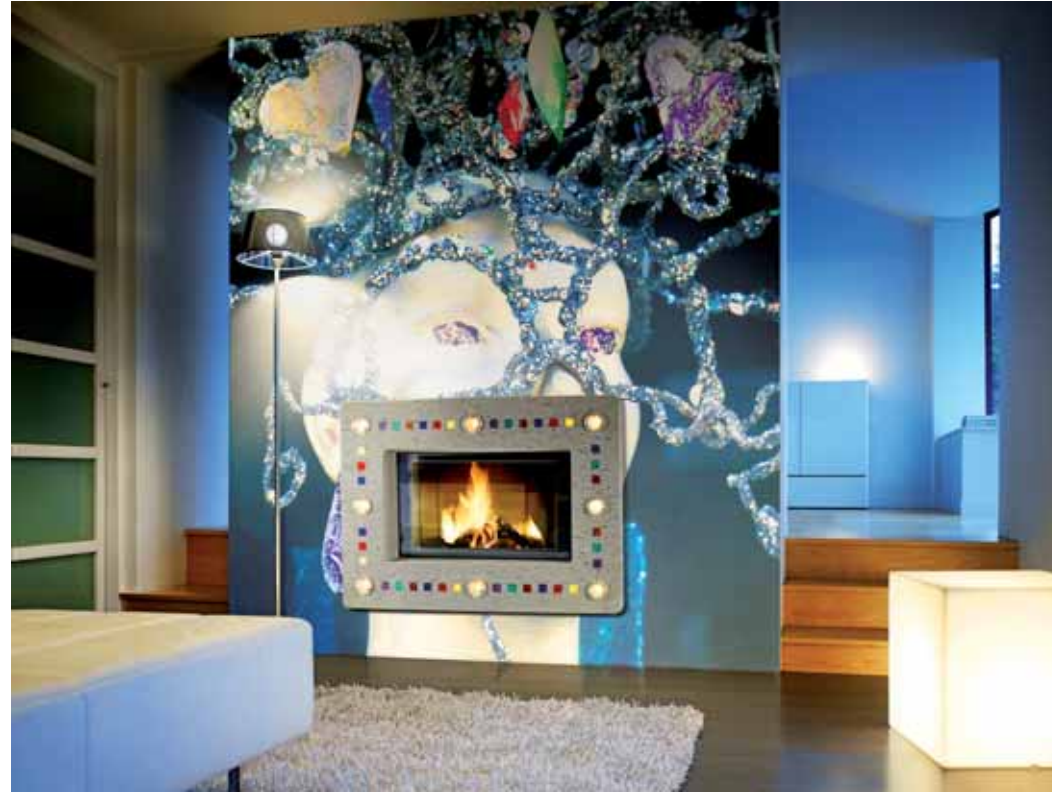
A l'horizontal ou à la verticale, l'habillage Ambilight intègre un système d'éclairage avec variateur d'intensité.

Outre l'intérêt que ce document représente auprès de votre compagnie d'assurance en cas d'incendie, l'opération de ramonage génère des économies d'énergies, réduit les risques d'intoxication, et de feu de cheminée.