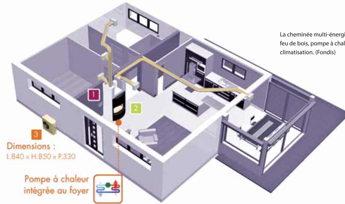
La cheminée multi-énergie associe feu de bois, pompe à chaleur et climatisation. (Fondis)

riés et originaux. Les styles et matériaux disponibles sont extrêmement divers : Briques, pierres blanches (taillées ou sciées), marbre, granite, espèces de bois sombres (chêne, etc.) Tant pour les intérieurs classiques que modernes.