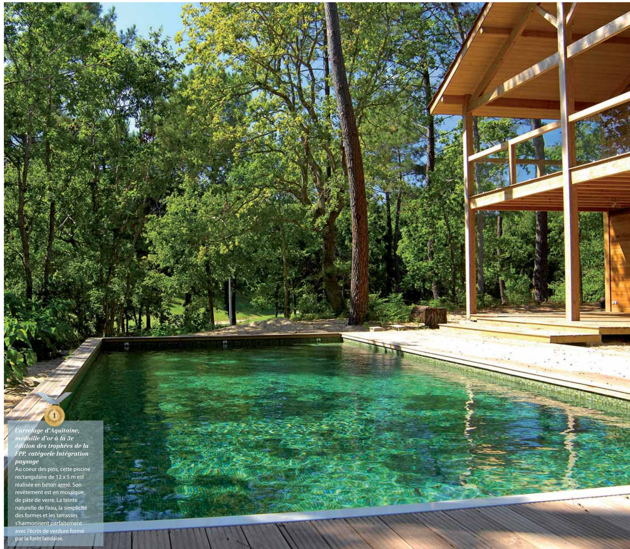
Carrelage d'Aquitaine, médaille d'or à la 3 e édition des trophées de la FPP, catégorie Intégration paysage

Quand la piscine se met au vert, le public tombe immédiatement sous le charme de ce jardin luxuriant. Exotique, à la Française ou avec des topiaires... il suffit de laisser aller son imagination pour créer une ambiance unique et chaleureuse. Seule règle à respecter : choisir les plantes en fonction du terrain et du climat ! Ce décor peut aussi être rythmé par des murets ou des décrochements. Enfin, une petite lumière bien placée sous un arbre ou à l'angle d'un rempart et c'est le tapis rouge assuré.