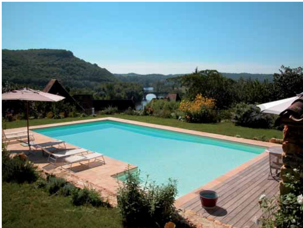
Piscines Plus, médaille d'or à la 3 e édition des trophées de la FPP, catégorie Design piscines familiales

Cette piscine rectangulaire est dotée, sur le côté, d'un escalier maçonné immergé. Elle mesure 12 m x 6 m et propose une pente composée. Son étanchéité est assurée par une membrane armée 150/100 de couleur sable. Elle est bordée d'une plage sur-mesure en pierres naturelles de Dordogne.