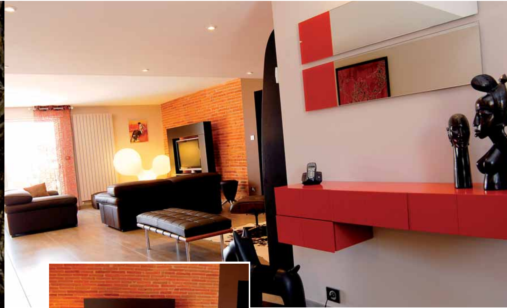
Une desserte en laque rouge trône dans l'entrée.

A une vingtaine de kilomètres de Toulouse, les dépendances d'un château avaient déjà fait l'objet, il y a une dizaine d'années, d'une rénovation sommaire, permettant de transformer le bâtiment en habitation. En 2007, la bâtisse est acquise par de nouveaux propriétaires qui décident de tout reprendre et de transformer les lieux en respectant leur cachet tout en apportant une véritable valeur ajoutée en termes d'aménagements et de confort. Ils commencent par reprendre l'extérieur installant sur leurs 5 000 mètres carrés de terrain, piscine, espaces verts, massifs arborés, sculptures en bois d'olivier, sans oublier la terrasse. Vient ensuite le tour du bâti avec comme point de départ l'idée de ne surtout pas perdre le cachet de cette demeure en briquettes, typique de la région toulousaine.