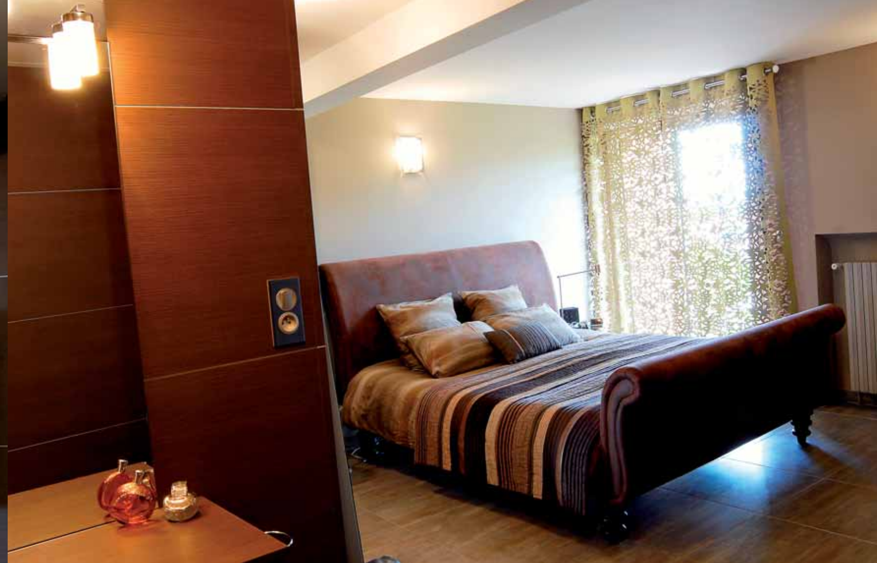
A côté de la coiffeuse, l'accès au dressing de la suite parentale.