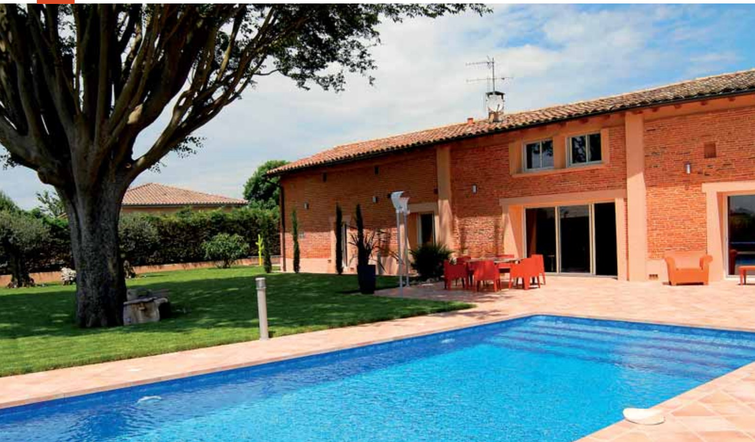
De larges ouvertures ont été créées en façade.