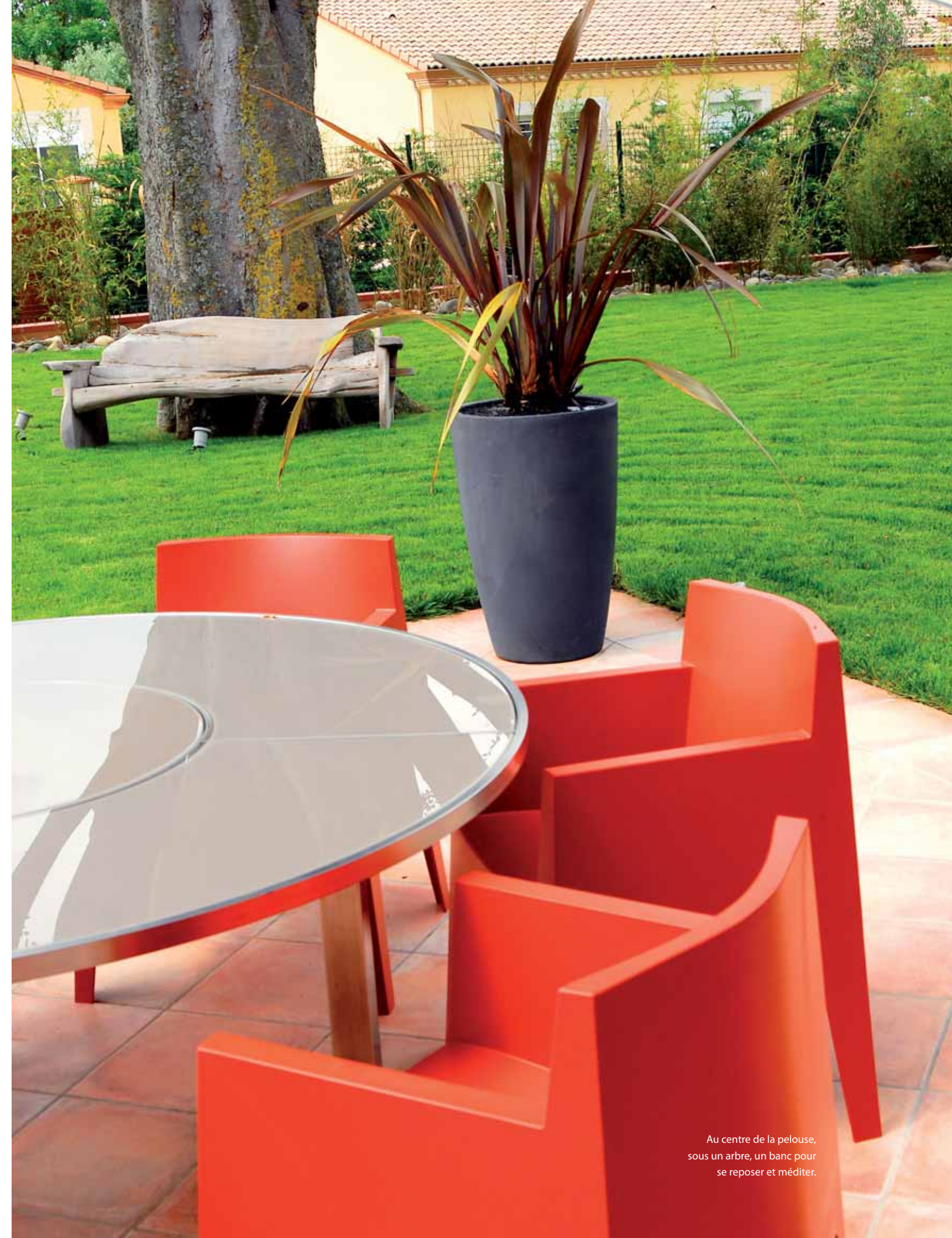
Au centre de la pelouse, sous un arbre, un banc pour se reposer et méditer.