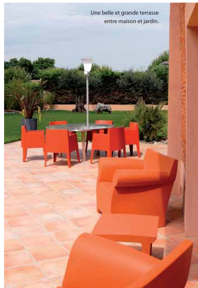
Une belle et grande terrasse entre maison et jardin.

LORSQUE LES DÉPENDANCES DU CHÂTEAU DEVIENNENT HABITATION, TOUT EST À REVOIR, DU SOL AU PLAFOND, SANS OUBLIER LES ESPACES EXTÉRIEURS. DES MURS EN BRIQUETTE AUX INTÉRIEURS RÉSOLEMENT CONTEMPORAINS, LE CONTRASTE EST SAISSANT ET LE RÉSULTAT MAGNIFIQUE.