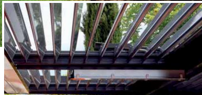
Une terrasse ombragée accueille la cuisine d'été.