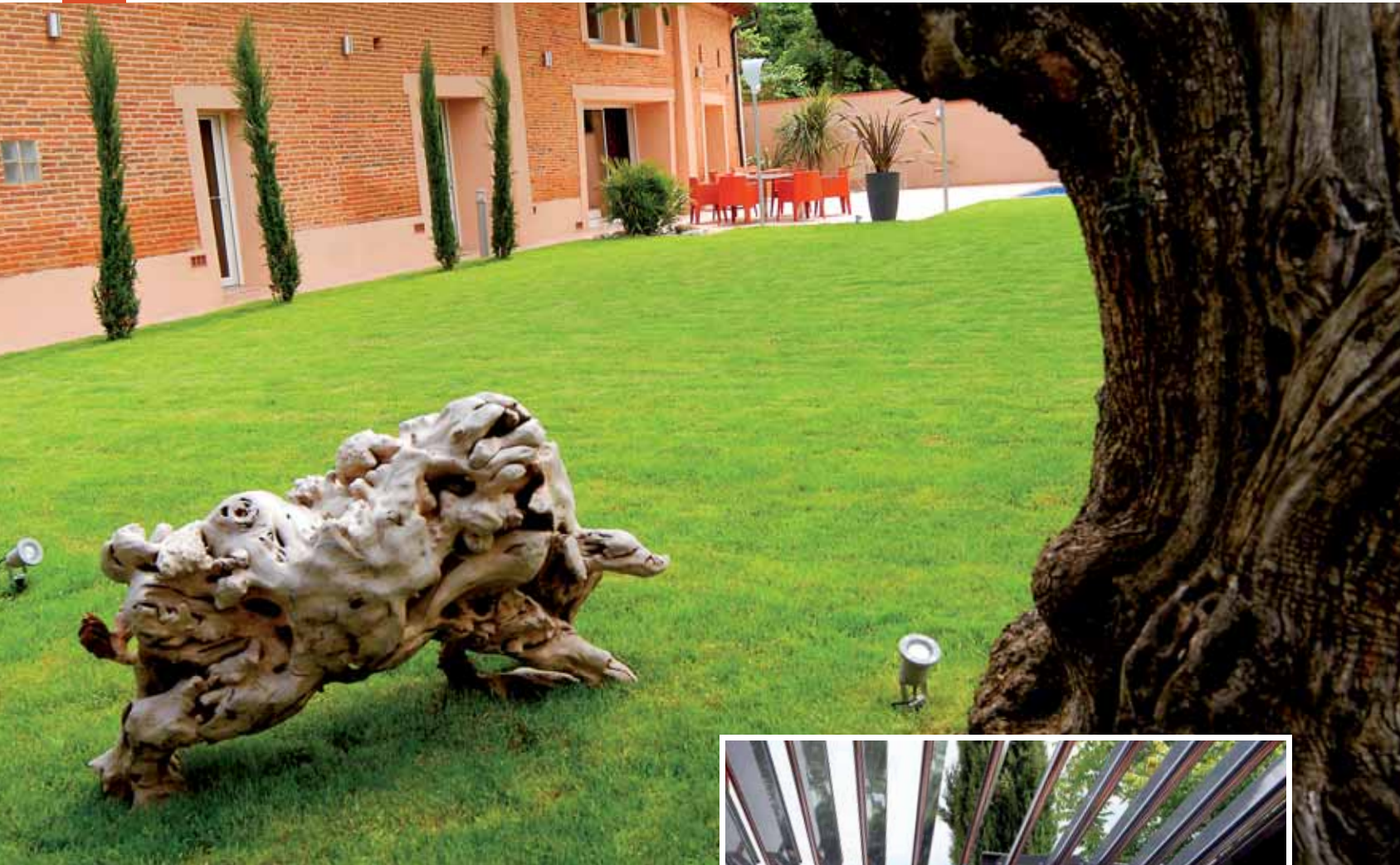
Quelques sculptures pour orner la pelouse.