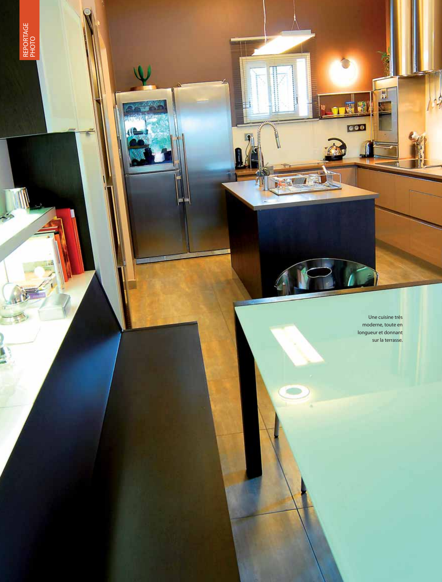
Une cuisine très moderne, toute en longueur et donnant sur la terrasse.