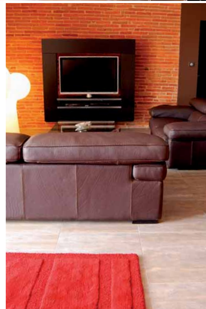
Un meuble spécialement créé pour intégrer l'écran plat

La façade est retravaillée afin d'aménager de larges ouvertures et transformer les fenêtres existantes en grandes baies donnant sur la piscine. Une terrasse abritée est également créée en parallèle, surmontée d'un brise-soleil, véritable espace de transition entre l'intérieur et l'extérieur. Le doux climat de la région permettant de profiter pendant de long mois de températures clémentes, cet espace dispose d'un coin cuisine et une longue table pour les repas. Le rez-de-chaussée de la maison, dont l'entrée est ornée d'un meuble en laque rouge, accueille un grand espace salon-salle à manger dans lequel a été installé un bar.