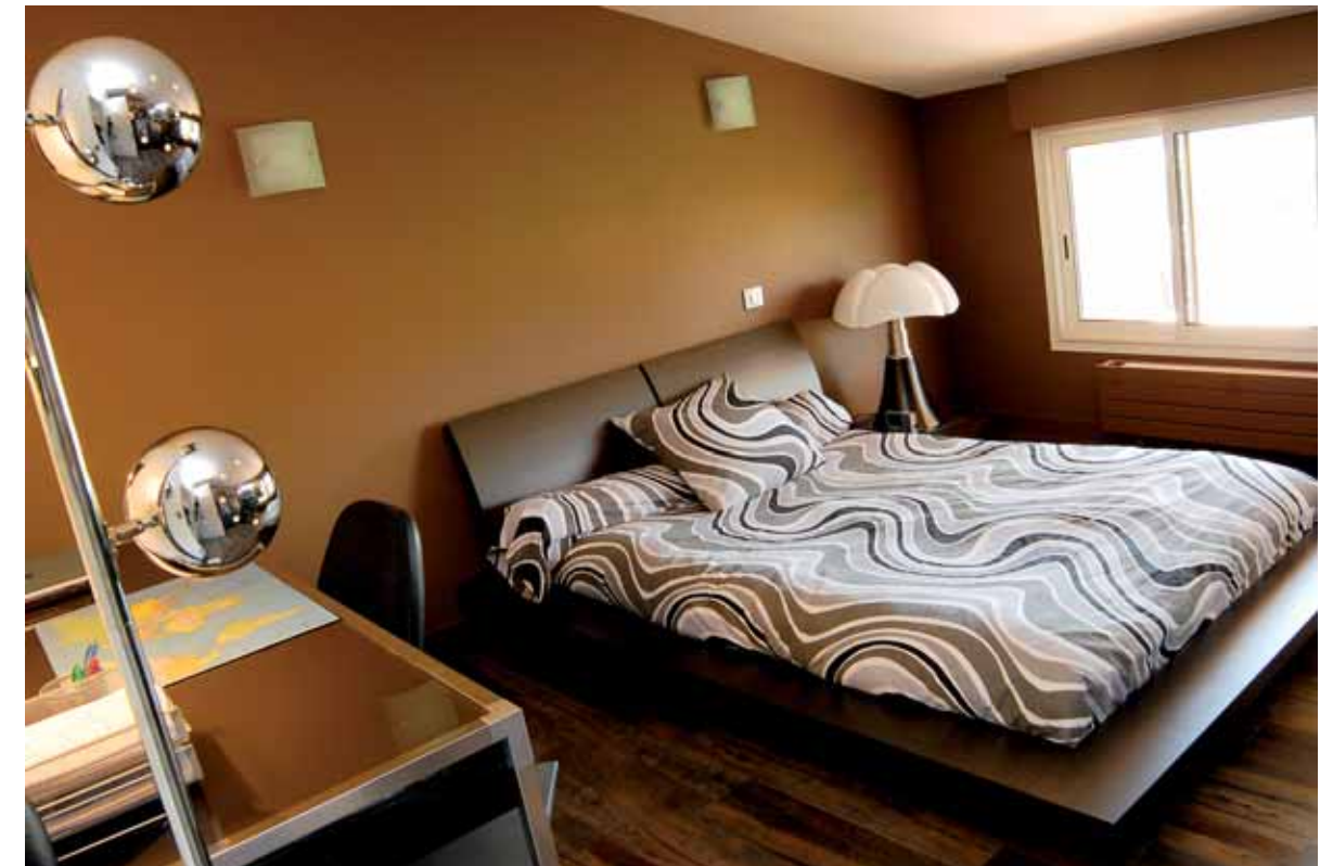
A l'étage, la chambre du fils dans des tons marron glacé.