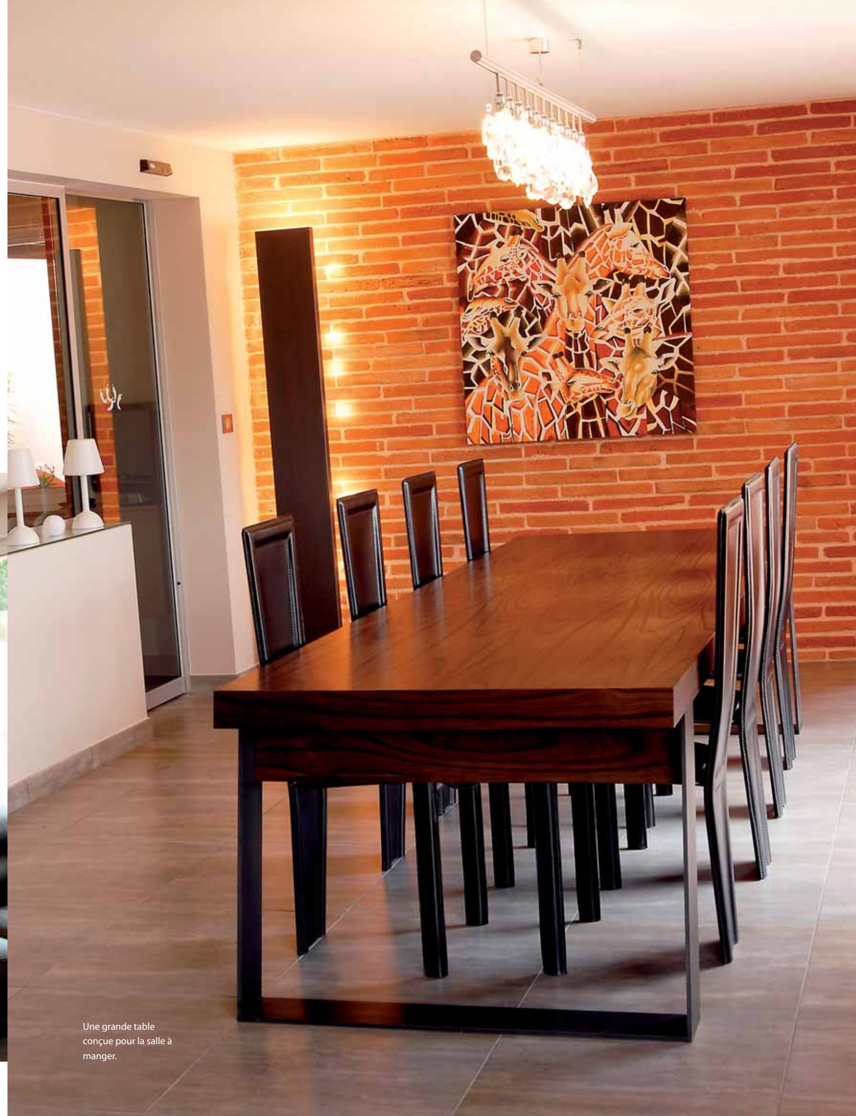
Une grande table conçue pour la salle à manger.