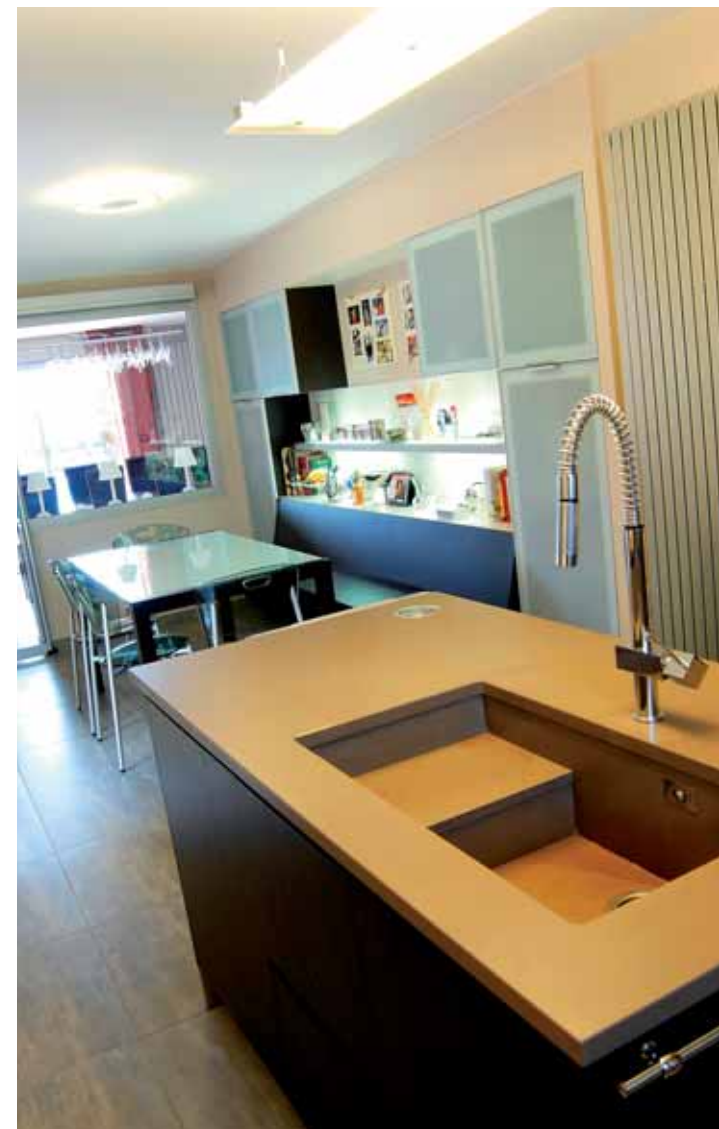
L'évier placé au centre de la cuisine.

“ Une ambiance extrêmement chaleureuse ”