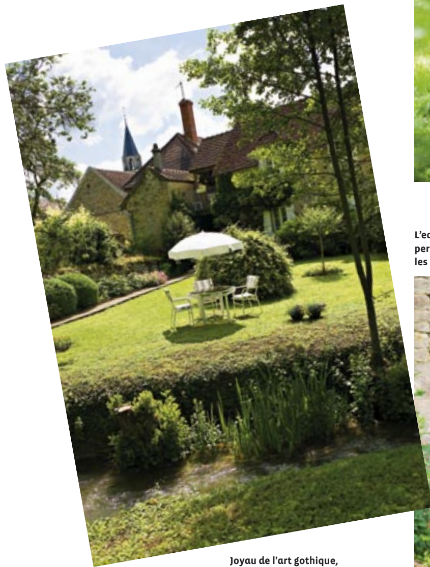
Joyau de l'art gothique, l'église Notre-Dame de Saint-Père en Vézelay se dresse fièrement vers le ciel.

Mais la trépidation de la grande ville bat encore dans vos tempes, et vous vous sentez confus, haletant. Sans même y penser, vous vous jetez dehors, et, tout à coup, vous perdez pied. De justesse, vos mains agrippent la portière et vous vous immobilisez. Enfin, vos yeux s'ouvrent. Vous voyez ce qui vous entoure pour la première fois depuis longtemps. Avant, vous ne faisiez que survoler la surface des choses. Maintenant, il vous semble que vous voyez leur intérieur !