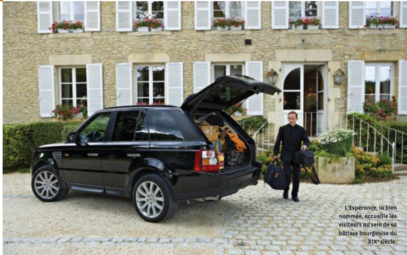
L'Espérance, la bien nommée, accueille les visiteurs au sein de sa bâtisse bourgeoise du XIX e siècle.