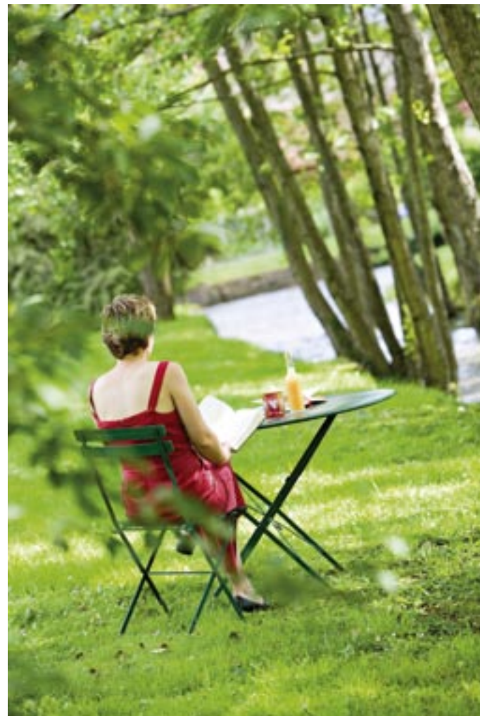
Quel plaisir de s'adonner à la lecture, assise au bord d'une des deux rivières traversant le domaine de 3 hectares...

L'eau s'écoule, dans un mouvement perpétuel, et ses remous dissimulent les méandres d'une vie secrète.