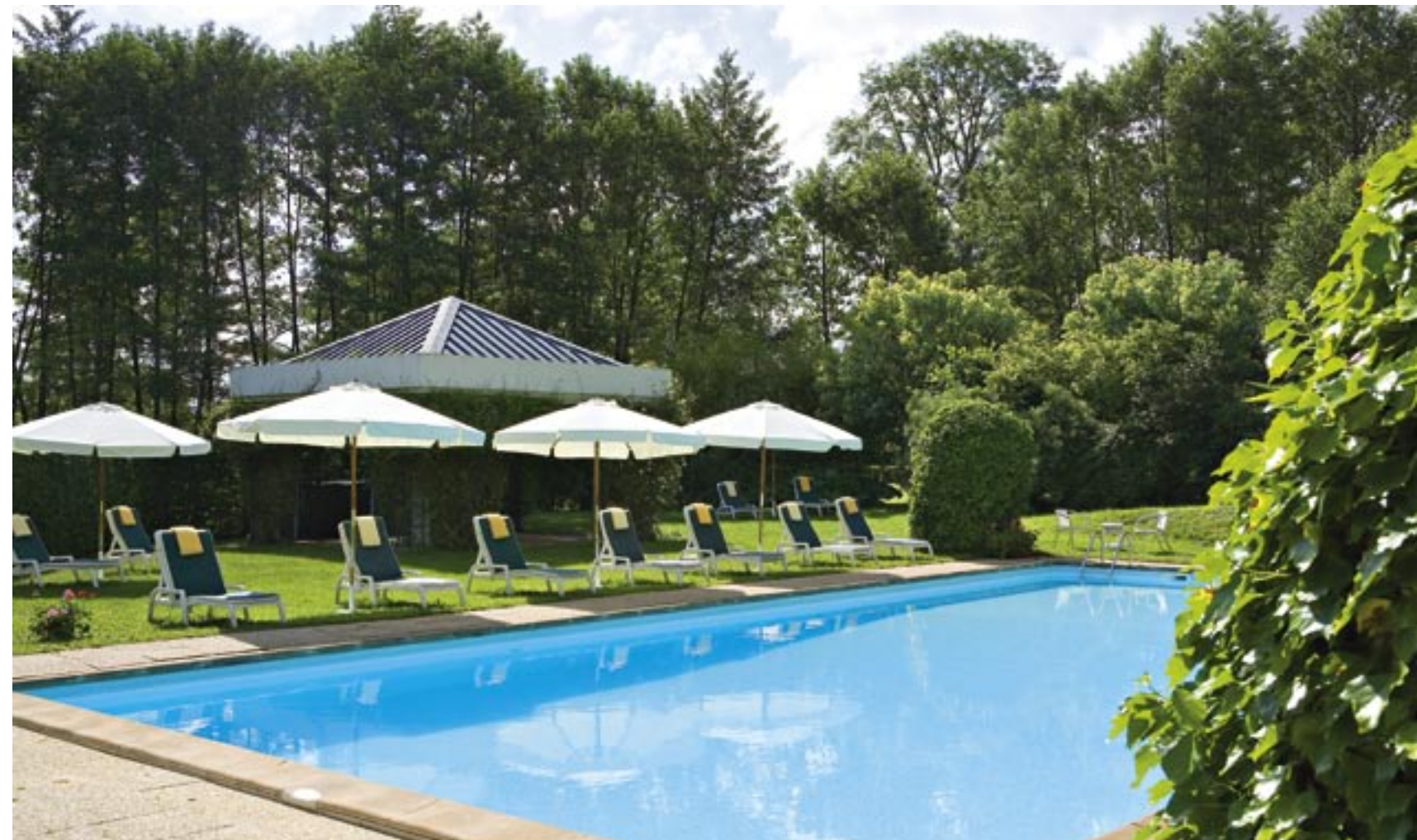
Le bassin bleu, frais, calme, limpide, n'attend que vous. Ça vous tente ?