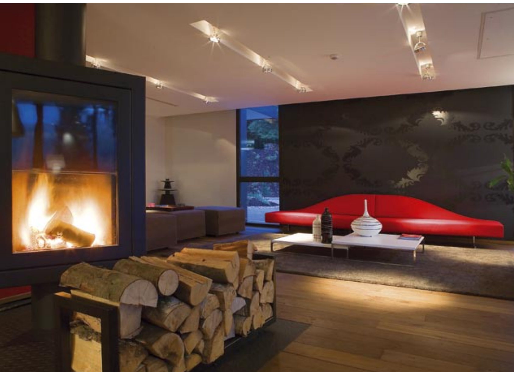
Style épuré, lignes géométriques et vastes volumes dans le salon rouge : si la décoration est minimaliste, elle est loin d'être froide.