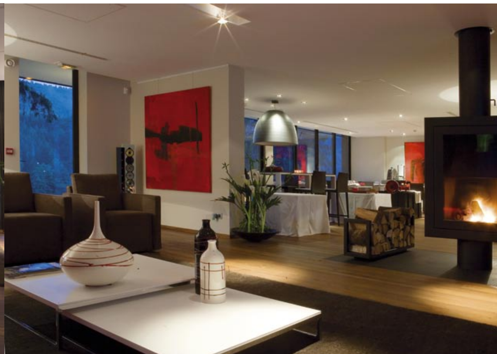
À droite, la cheminée pivotante et toujours ces grandes ouvertures sur l'extérieur.

“ Cet endroit, je l'ai voulu comme une maison, pas comme un hôtel ”