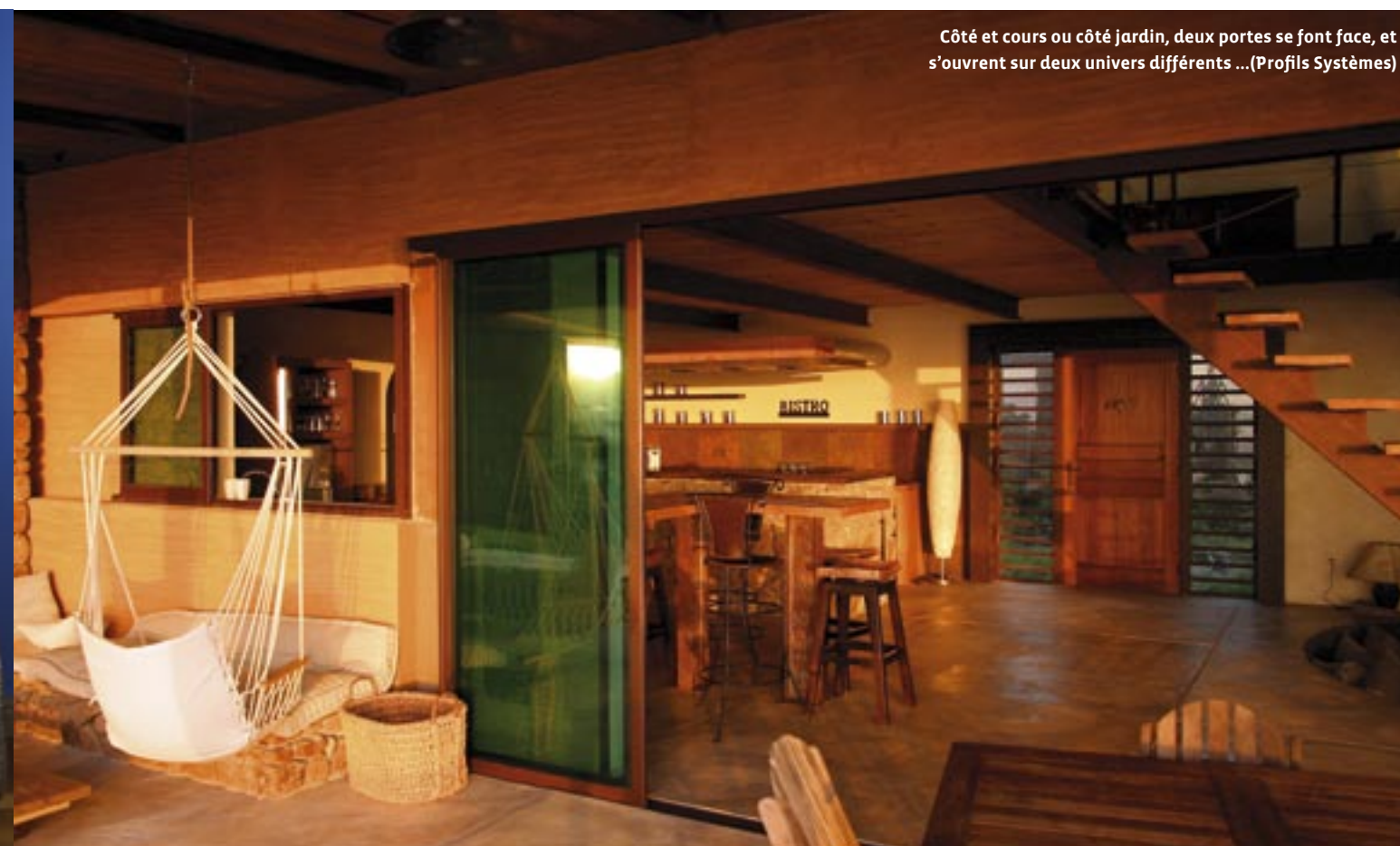
Côté et cours ou côté jardin, deux portes se font face, et s'ouvrent sur deux univers différents... (Profils Systèmes)