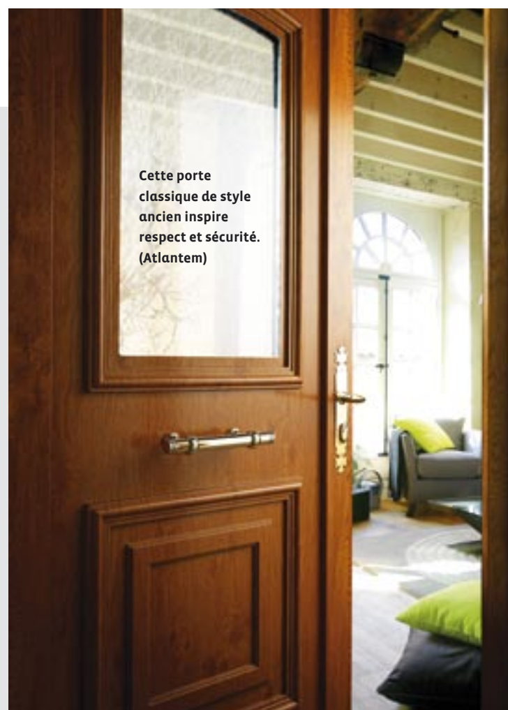
Cette porte classique de style ancien inspire respect et sécurité. (Atlantem)

Fabriqués traditionnellement, à partir de fibres de bois transformés industriellement, les panneaux post formés Masonite, possèdent une longévité remarquable. Ainsi, les blocs-portes Masonite ne se déforment et ne se fendillent pas. Ces produits bénéficient, en outre, de la Certification FSC qui atteste de l'origine des bois et de la gestion responsable de leur forêt de provenance.