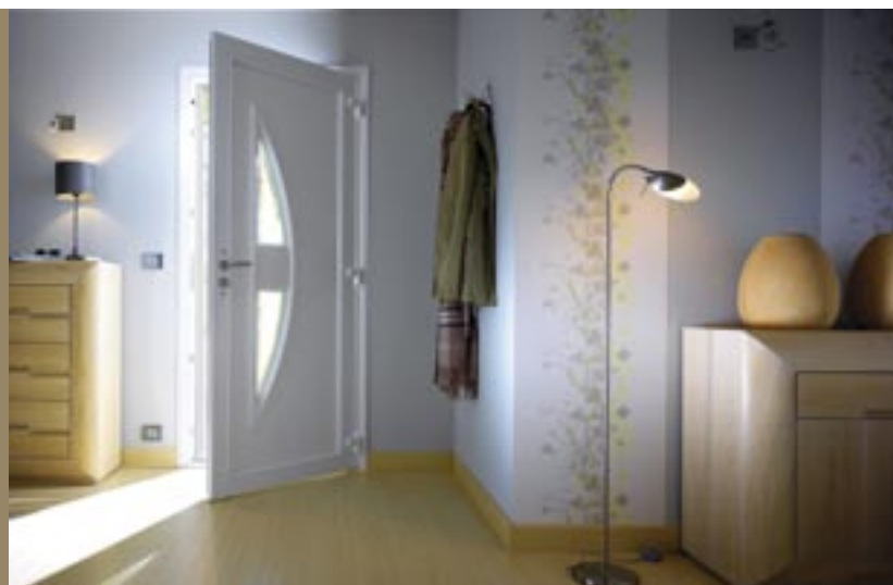
La collection PVC offre des lignes sobres et un mariage réussi avec vitrages et fusing. (Atlantem)

ne propage pas les flammes. Insensible aux conditions climatiques comme aux variations de température, elle endure parfaitement les rayons ultraviolets, l'air marin ou la pollution. La porte d'entrée en PVC est facile à vivre. Son entretien, à l'eau savonneuse, est fait en un tour de main.