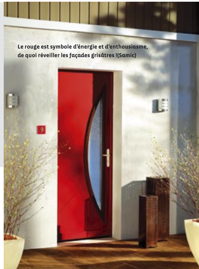
Le rouge est symbole d'énergie et d'enthousiasme, de quoi réveiller les façades grisâtres ! (Samic)

Une grande durabilité, inhérente à la stabilité du métal (acier), mais aussi aux produits de finition, et de hautes performances thermiques. L'acier, bon marché, s'adresse en priorité au marché des constructeurs et des portes standards. L'offre en termes de couleurs et de nombre de produits est de fait plus limitée.