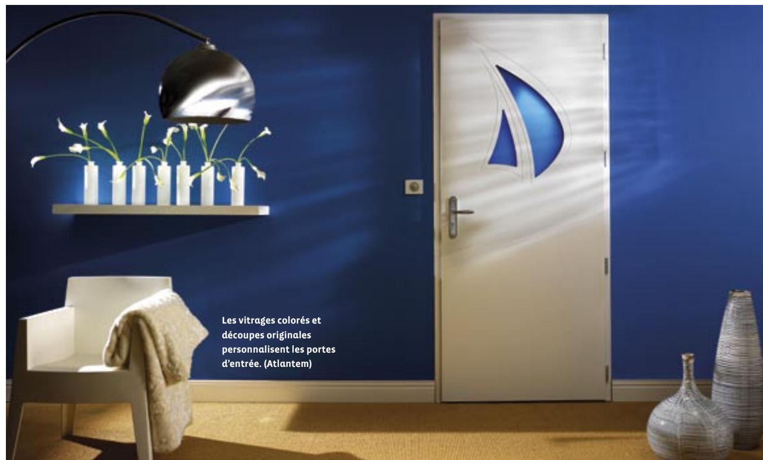
Les vitrages colorés et découpes originales personnalisent les portes d'entrée. (Atlantem)

S'agissant du prix, il s'étend de quelque centaines d'euros pour une porte standard (taille) en acier notamment à plusieurs milliers d'euros pour une porte en chêne de France, faite sur mesure avec des accessoires (boîte à lettre, heurtoir,...). Et plus elle sera personnalisée, plus son prix sera élevé. Néanmoins des aménagements de paiement à crédit ou en plusieurs fois sont souvent proposés par les vendeurs.