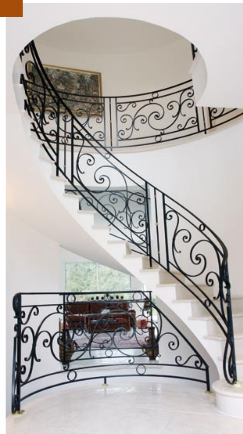
Rampe et garde-corps trône dans un espace dédié à leur beauté. Leurs boucles et volutes en fer forgé se dessinent sur le mur blanc de cette splendide demeure. (Ferronnerie de la Brie)