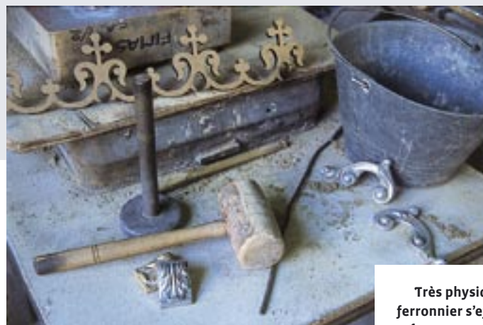
Très physique, le métier de ferronnier s'effectue de la même façon que naguère. Le métal liquide est versé dans des moules. (L'Officina Dei Giardini)

malléabilité surprennent, et permettent toutes les audaces. Votre imagination peut se déployer, et vous pouvez mettre sur pied le projet dont vous aviez rêvé, avec l'aide d'un artisan ferronnier qui vous aidera à formaliser par le dessin ce qui était évanescent et du domaine de l'esprit.