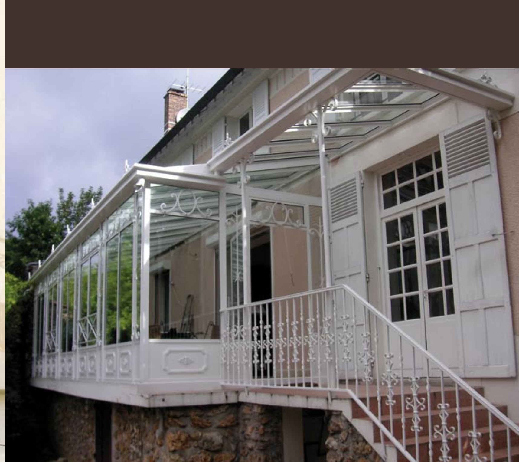
Véranda et rampe en acier travaillé apportent à la maison un relief esthétique très agréable à l'œil. (Lucien Longueville)