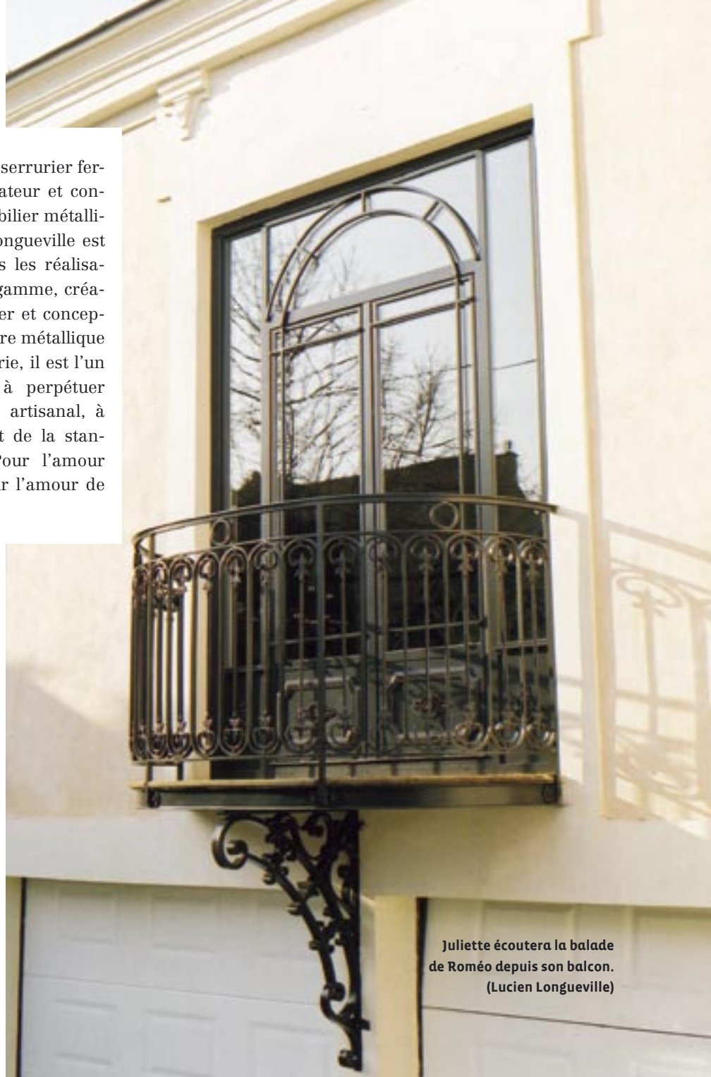
Juliette écouter la balade de Roméo depuis son balcon. (Lucien Longueville)

forme, son épaisseur, on découvre les goûts des propriétaires et un peu de ce qu'ils sont se révèle. Un portail imposant suggère déjà une personne imposante. Une marquise frêle, des gens simples et abordables. Mais pourquoi se cacher ? La réaffirmation de soi a quelque chose de frais et de vivant qui ressemble fort à la liberté. Exister, tel que l'on est, en être fier et le dire, plutôt que se fondre dans la foule. Le mouvement est en marche ! A qui le tour ?