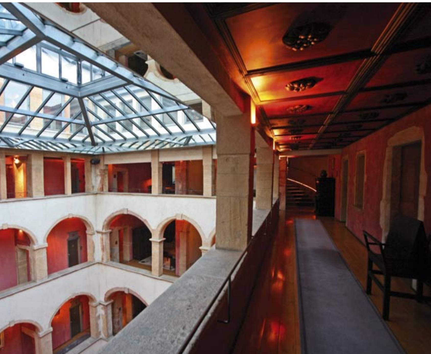
Les coursives, sur quatre niveaux, dominent le restaurant qui a pris place sous la magnifique verrière de la Cour des Loges.

« J'ai vraiment été séduite par cet endroit magique »