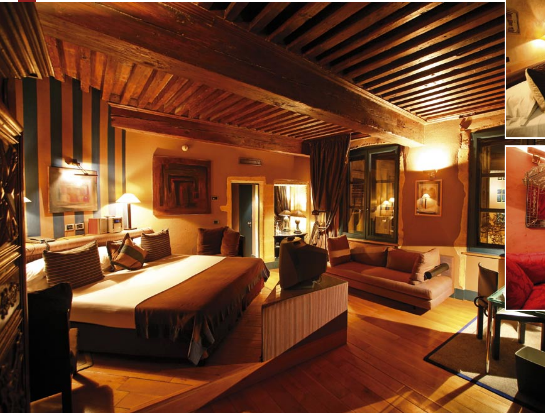
La chambre Piazzetta, à cinq f magnifiques poutres du plafond. Très spacieuse, elle donne sur la place du petit Collège.