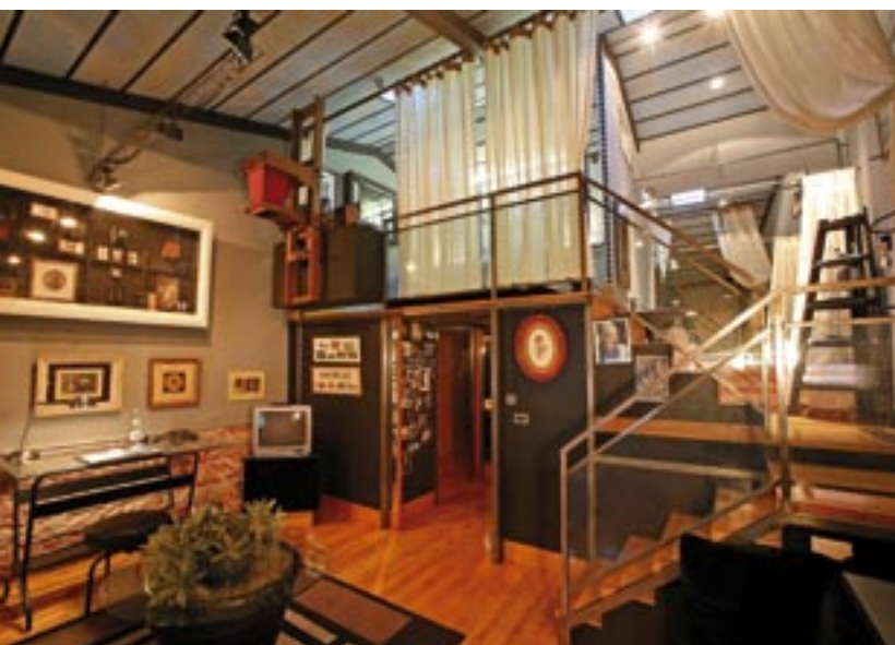
La réception s'inscrit dans le même esprit de tradition et de modernité, toujours marqué par l'omniprésence de la pierre.

L'atelier du photographe a été aménagé en fumoir, pour les nombreux amateurs de cigare que compte la Cour des Loges.