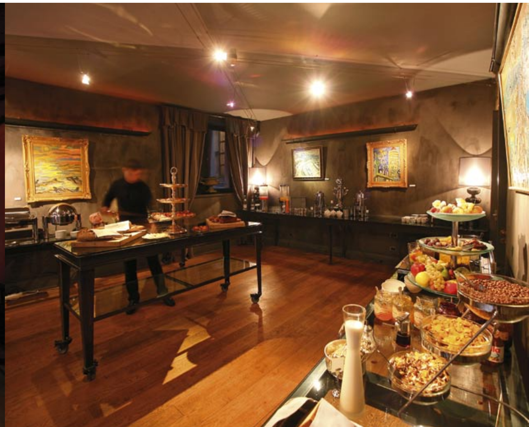
Mélange subtil des matières, meubles Renaissance et ambiance raffinée : La Cour des Loges est l'un des joyaux du Vieux-Lyon.