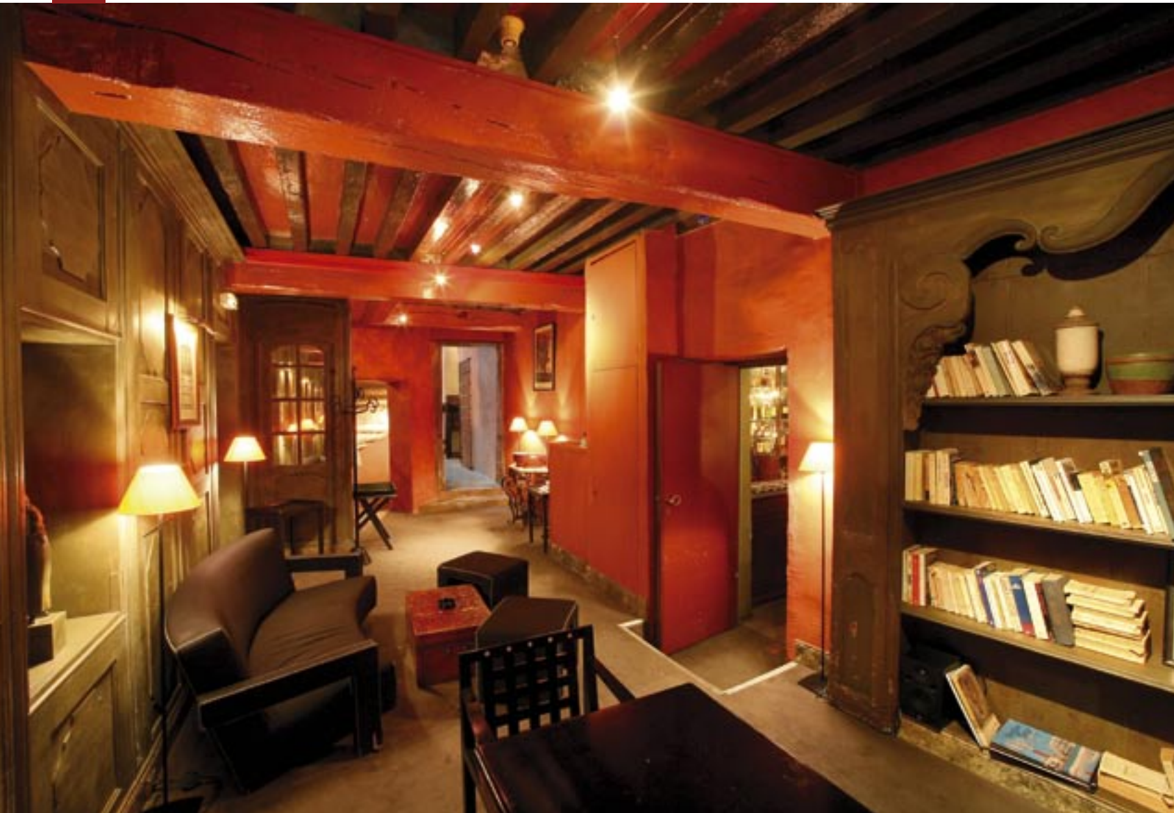
L'hôtel, repris en 2000, s'impose par un style volontairement contemporain de sa décoration intérieure, comme ici dans le fumoir.

L'atelier du photographe a été aménagé en fumoir, pour les nombreux amateurs de cigare que compte la Cour des Loges.