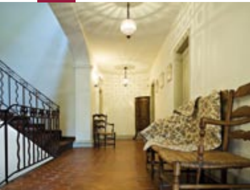
L'agencement d'origine des pièces a été conservé.