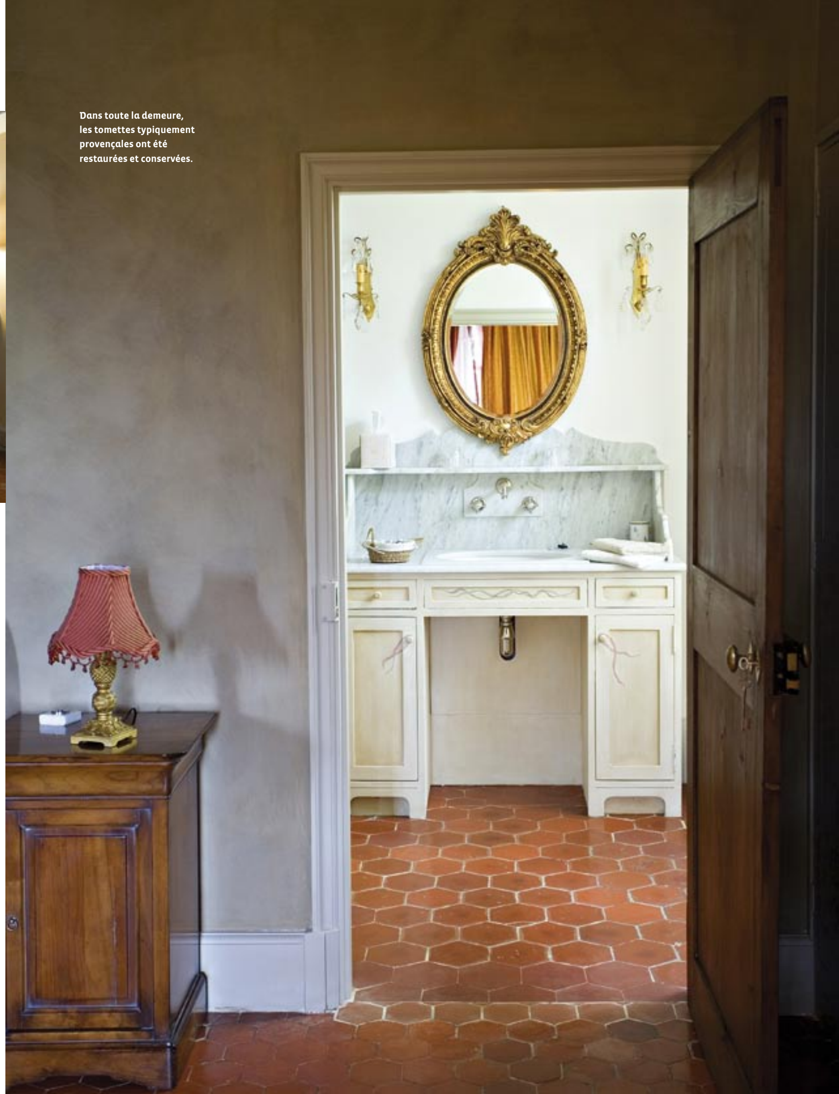
Dans toute la demeure, les tomettes typiquement provençales ont été restaurées et conservées.

La difficulté du projet résidait précisément dans cette équation : comment apporter le confort moderne sans tout casser ? La décision a notamment été prise d'installer un système de chauffage central avec des plaquettes de bois permettant de chauffer les 1000 m 2 avec une autonomie de 3 semaines à un mois en hiver. Économique et respectueux de l'environnement, le système utilise le bois du domaine.