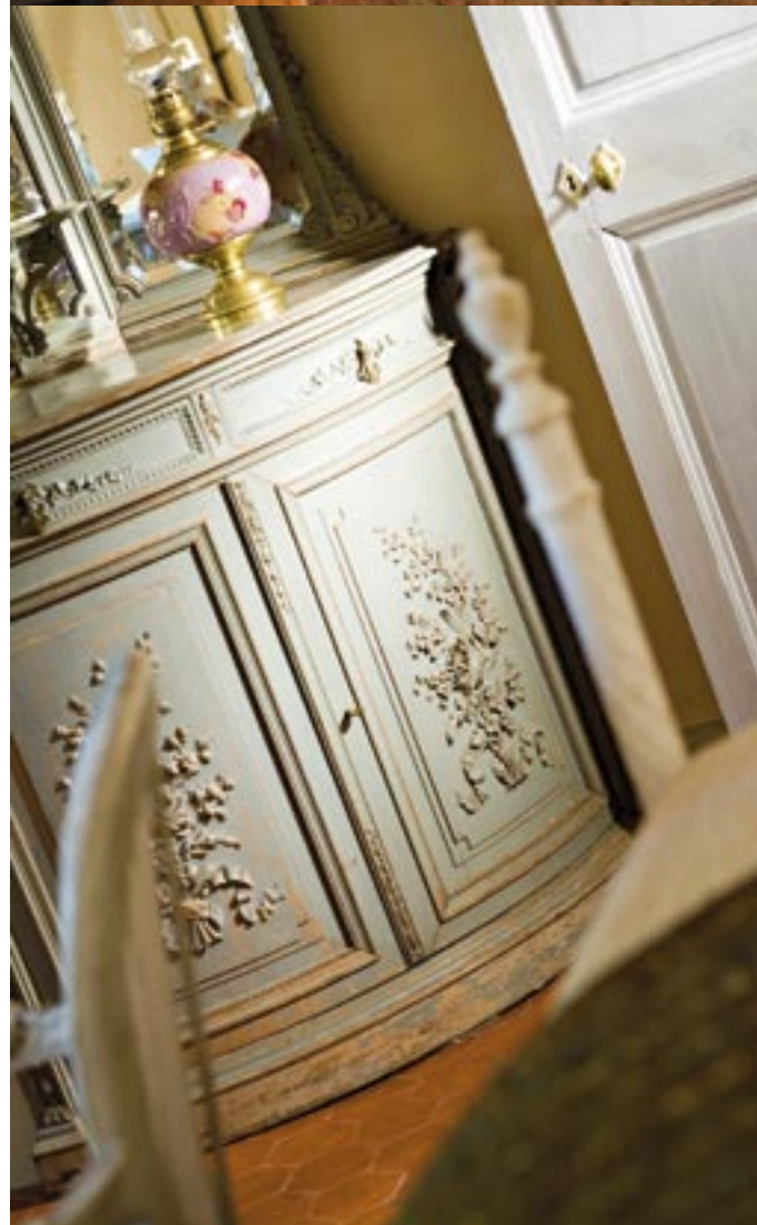
La rénovation des lieux avait pour ambition de préserver le cachet et le charme du passé.

La difficulté du projet résidait précisément dans cette équation : comment apporter le confort moderne sans tout casser ? La décision a notamment été prise d'installer un système de chauffage central avec des plaquettes de bois permettant de chauffer les 1000 m 2 avec une autonomie de 3 semaines à un mois en hiver. Économique et respectueux de l'environnement, le système utilise le bois du domaine.