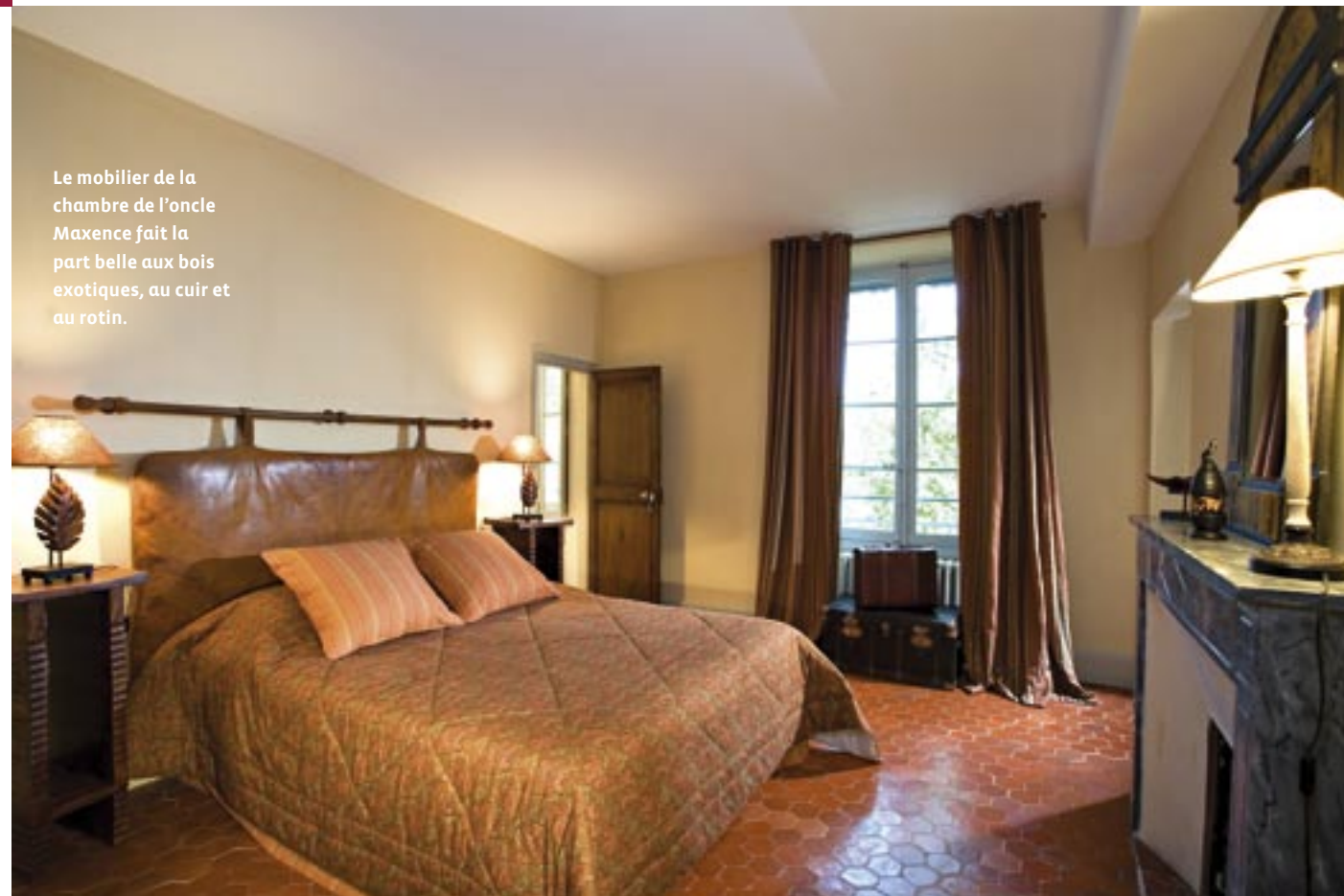
Le mobilier de la chambre de l'oncle Maxence fait la part belle aux bois exotiques, au cuir et au rotin.