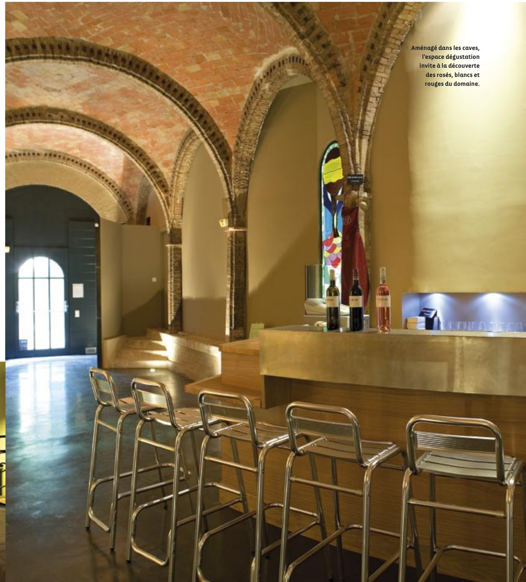
Aménagé dans les caves, l'espace dégustation invite à la découverte des rosés, blancs et rouges du domaine.