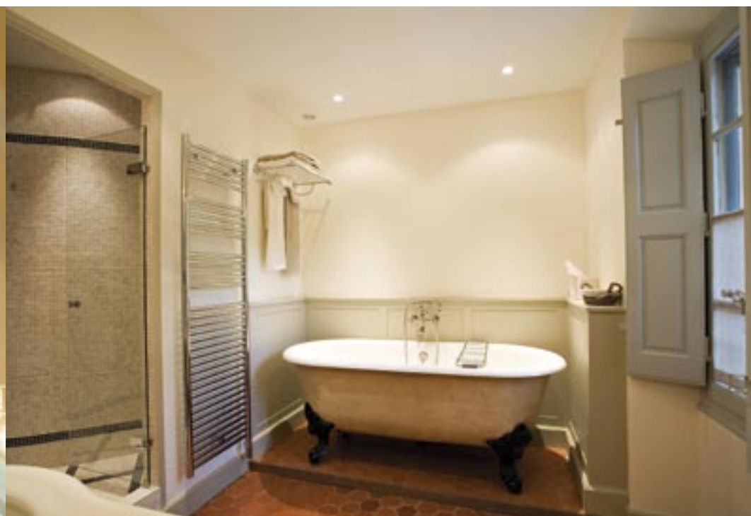
Baignoire ancienne et radiateur design : la salle de bains de Mathilde mêle classicisme et modernité.