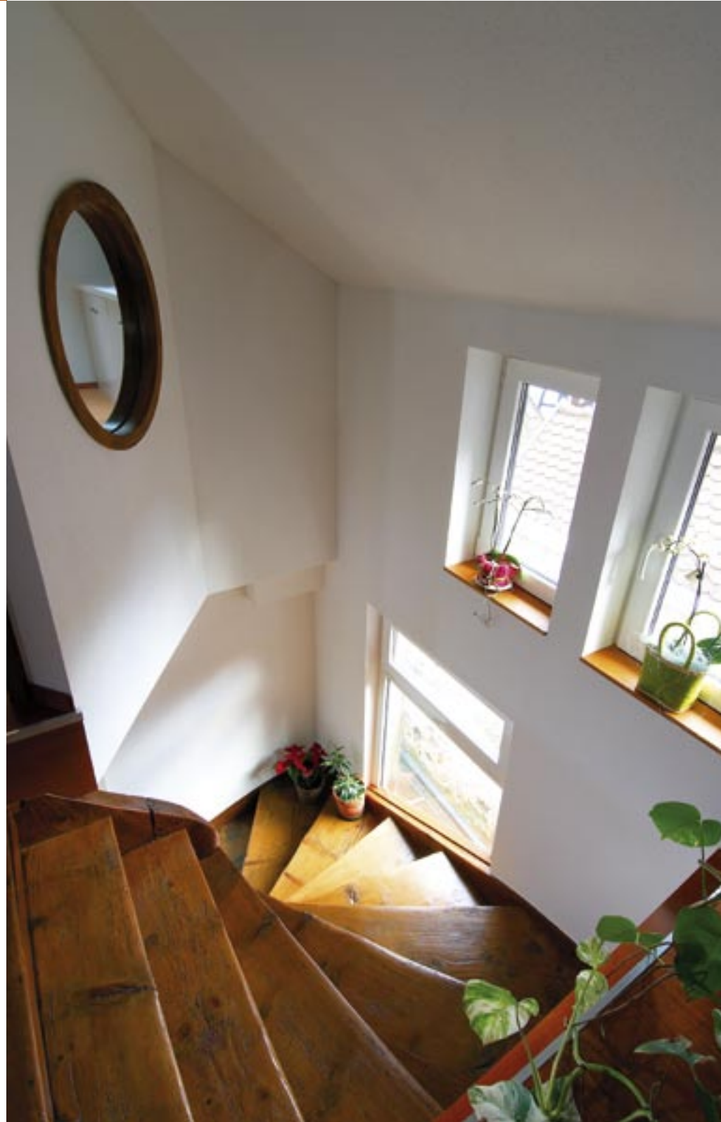
L'escalier d'origine permettant d'accéder aux combles a été conservé.