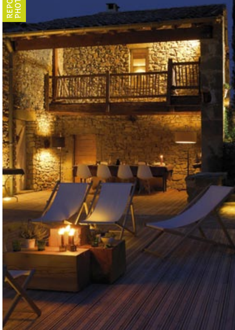
La terrasse en bois tropical promet des heures de détente sous la voûte céleste.