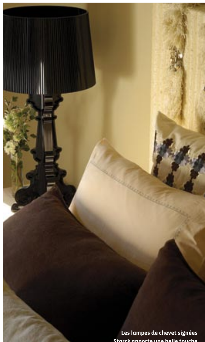
Les lampes de chevet signées Starck apporte une belle touche de modernité dans un décor d'inspiration rustique.