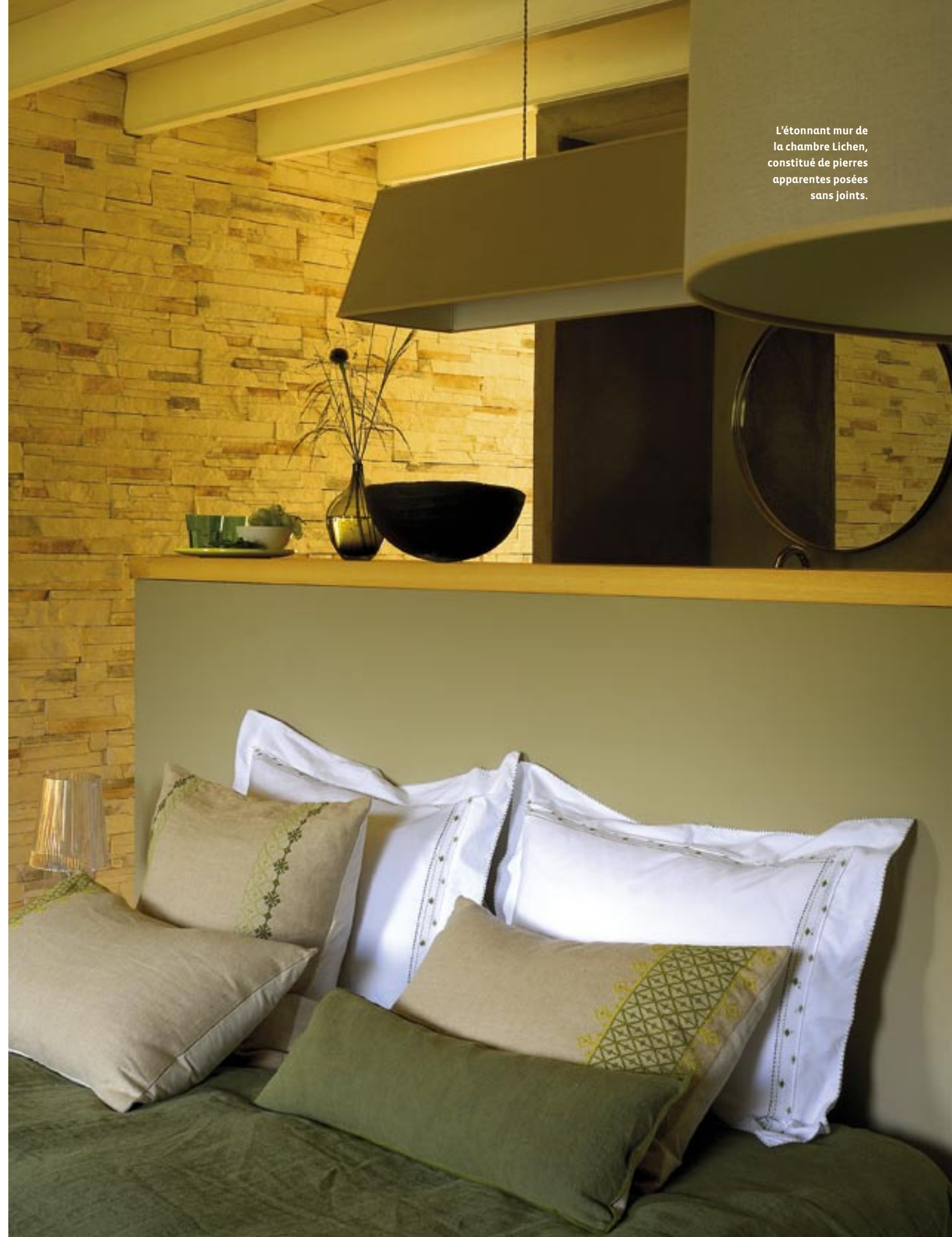
L'étonnant mur de la chambre Lichen, constitué de pierres apparentes posées sans joints.

Place au vert des bois et des sous-bois dans la chambre Lichen. Le mur étonnant, constitué de pierres apparentes posées sans joint, et les billots de bois en guise de tables de chevet récitent un vocabulaire rustique de cabane en forêt. Les lampes design, signées Philippe Starck créent un contraste inspiré. Derrière la tête de lit, la salle d'eau décorée à l'italienne, en ciment brut teinté et traité avec un produit imperméabilisant, prolonge cet esprit à la fois brut et moderne, naturel et contemporain.