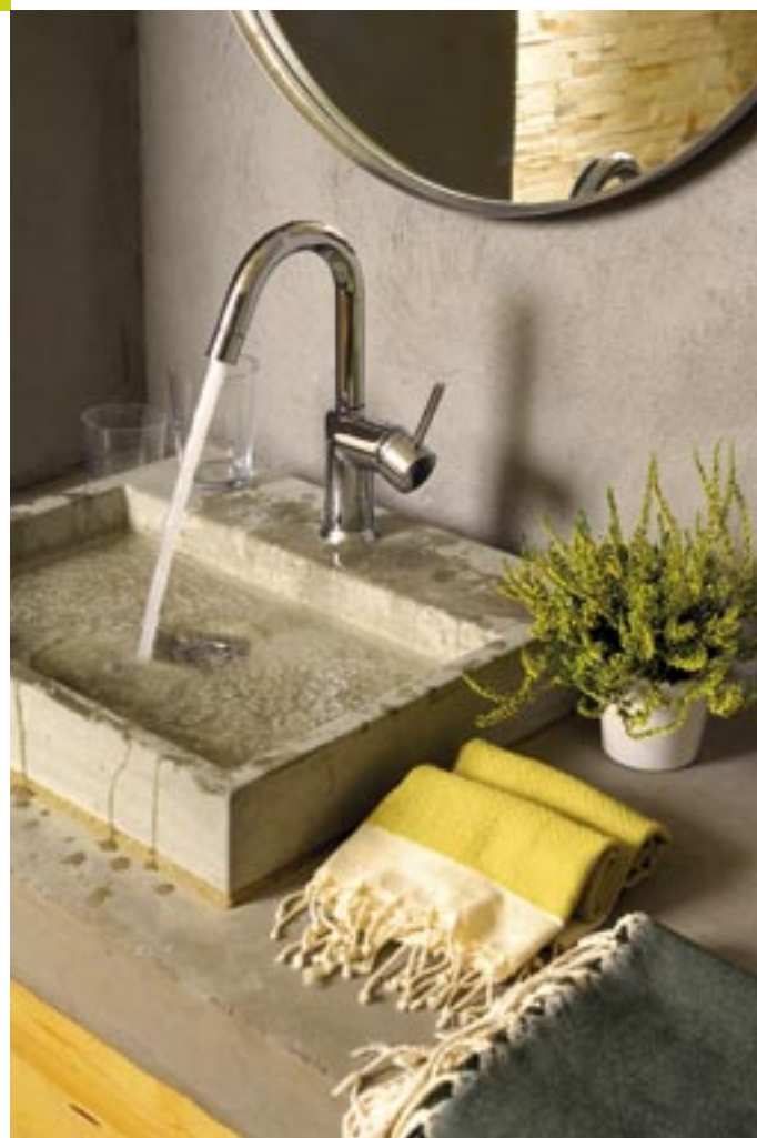
La vasque en ciment brut traité dans la salle d'eau de la chambre Lichen crée une ambiance à la fois moderne et authentique.