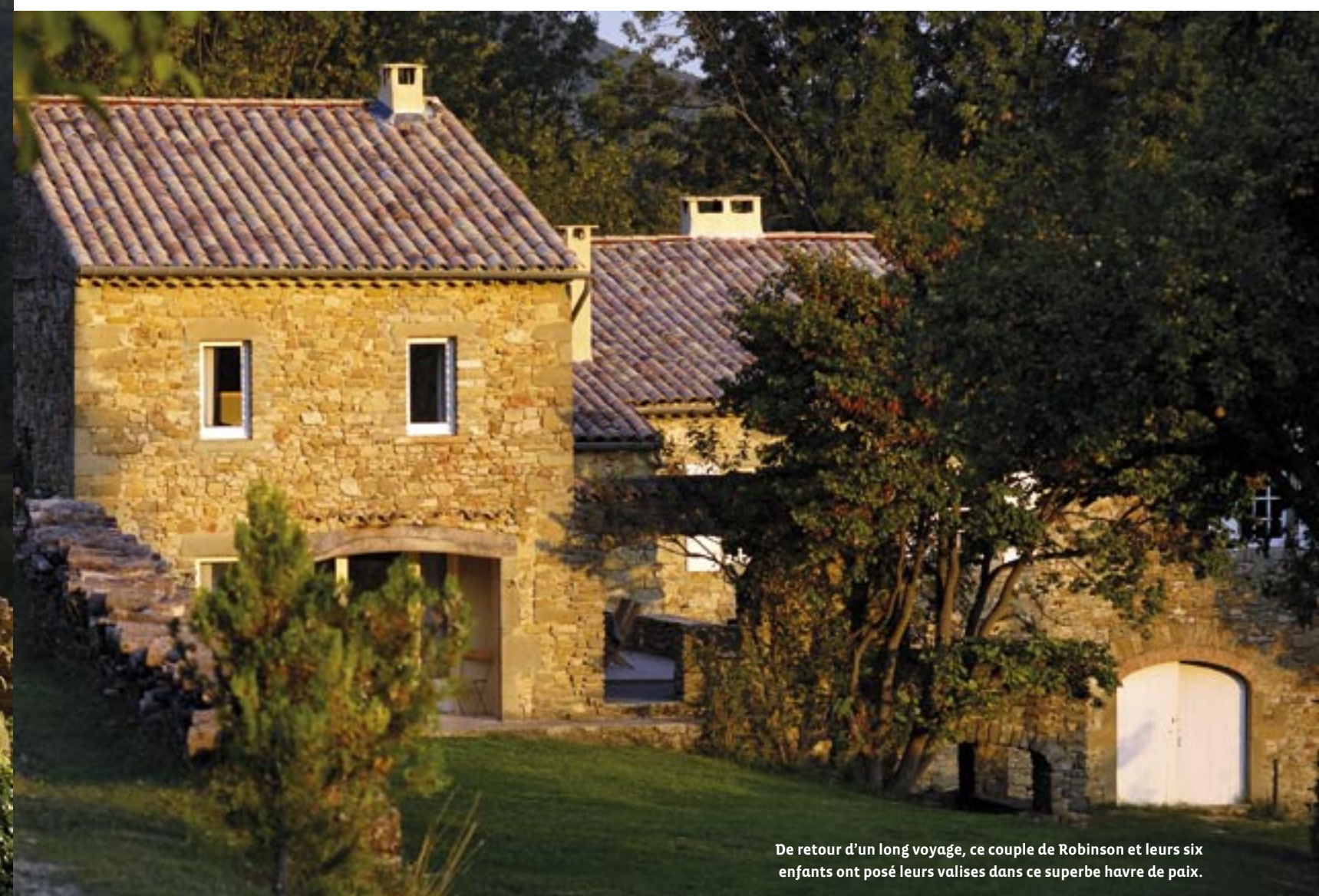
De retour d'un long voyage, ce couple de Robinson et leurs six enfants ont posé leurs valises dans ce superbe havre de paix.