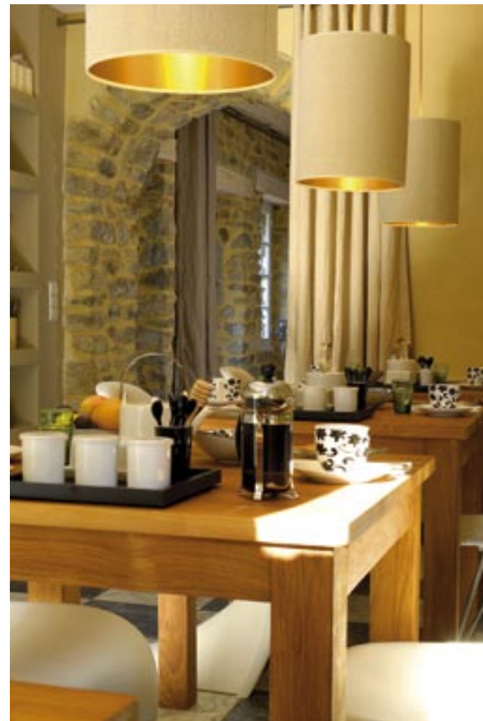
Une cuisine hors du temps dans laquelle la modernité a su endosser les habits du passé.