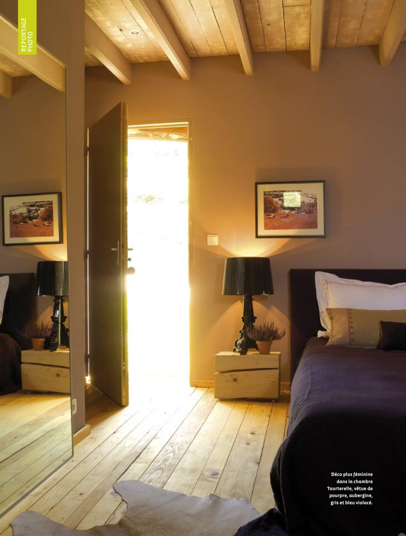
Déco plus féminine dans la chambre Tourterelle, vêtue de pourpre, aubergine, gris et bleu violacé.