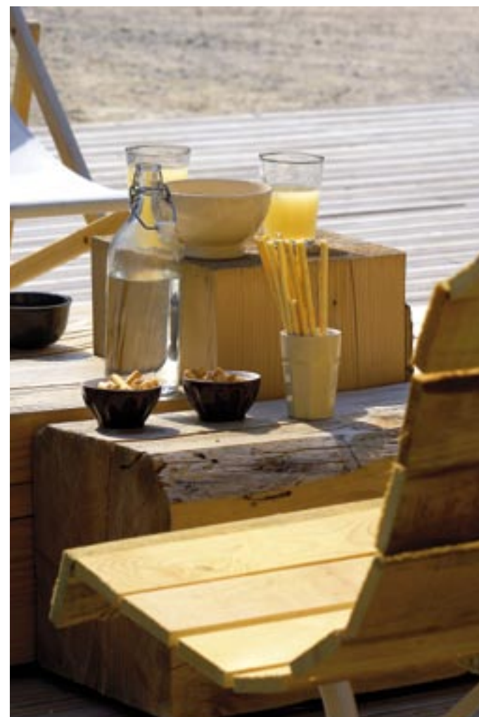
Petit déjeuner ensoleillé autour de la table basse outdoor faite de cubes de pin.

Confié aux deux gérants de la boutique de déco Hand, à Lyon, l'un d'eux étant le frère de la maîtresse de maison, l'aménagement intérieur fait la part belle à la simplicité, la nature, la rusticité, en intégrant par petites touches des aspects plus design ou ethniques. Un seul mot d'ordre ici : harmonie.