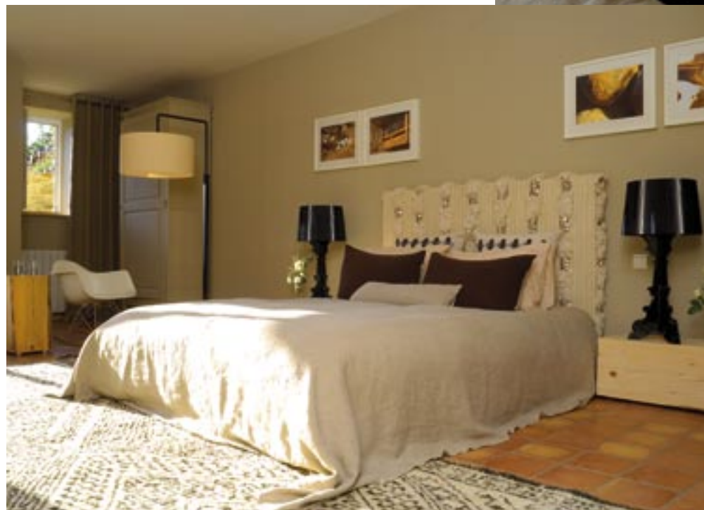
Tomettes, lin et laine bouillie dans la chambre Argile, la plus champêtre.

Place au vert des bois et des sous-bois dans la chambre Lichen. Le mur étonnant, constitué de pierres apparentes posées sans joint, et les billots de bois en guise de tables de chevet récitent un vocabulaire rustique de cabane en forêt. Les lampes design, signées Philippe Starck créent un contraste inspiré. Derrière la tête de lit, la salle d'eau décorée à l'italienne, en ciment brut teinté et traité avec un produit imperméabilisant, prolonge cet esprit à la fois brut et moderne, naturel et contemporain.