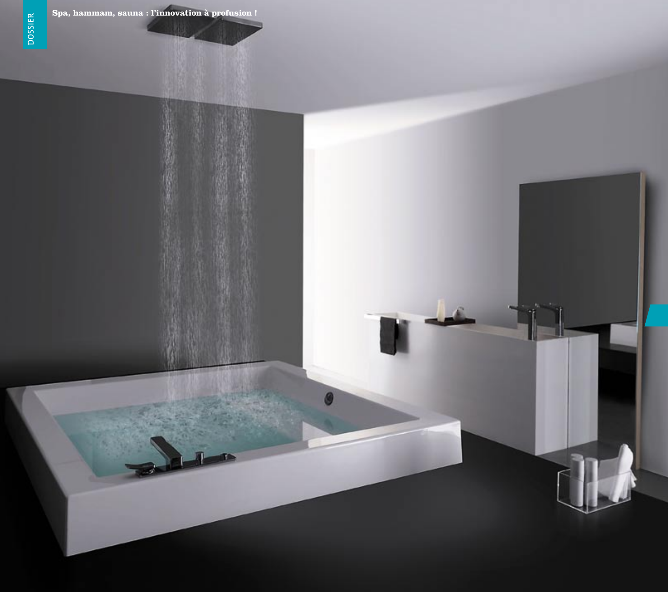
La baignoire à eau procure les mêmes sensations qu'un massage et possède un effet relaxant (Zucchetti).

Spa, hammam, sauna : l'innovation à profusion !