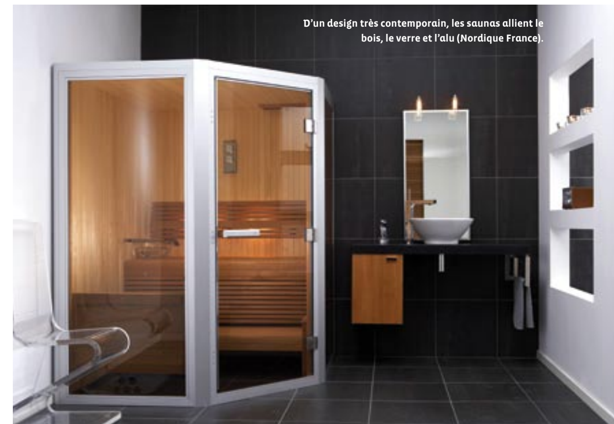
D'un design très contemporain, les saunas allient le bois, le verre et l'alu (Nordique France).