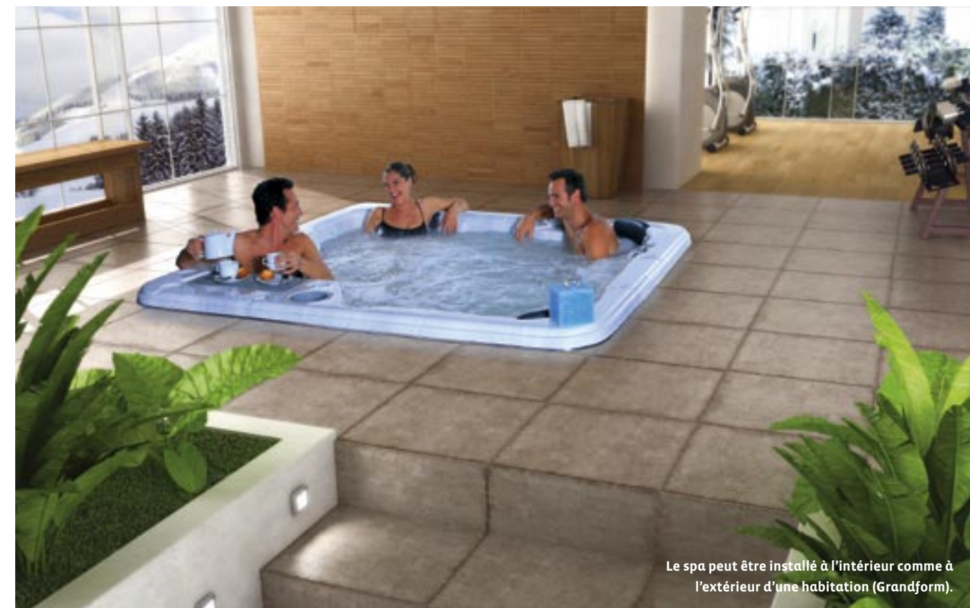
Le spa peut être installé à l'intérieur comme à l'extérieur d'une habitation (Grandform).