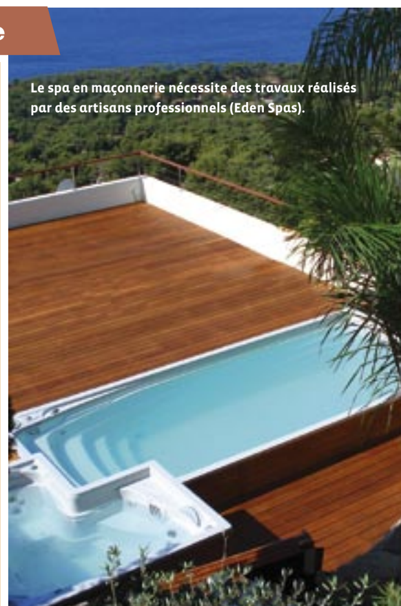
Le spa en maçonnerie nécessite des travaux réalisés par des artisans professionnels (Eden Spas).

fibre optique. Les mélomanes apprécieront, quant à eux, le « Spa musicale » de la société Aqua Musique. Muni de deux haut-parleurs subaquatiques, ce spa offre une relaxation totale misant sur la régénération complète du corps et de l'esprit. La société Planete Spa a, de son côté, pensé aux familles nombreuses en lançant le spa « Emotion », équipé de 6 places. Ce modèle favorise le massage cervical tout en émettant de la musique grâce au lecteur CD/Radio intégré. Séduisant... Encore faut-il avoir les mêmes goûts musicaux !