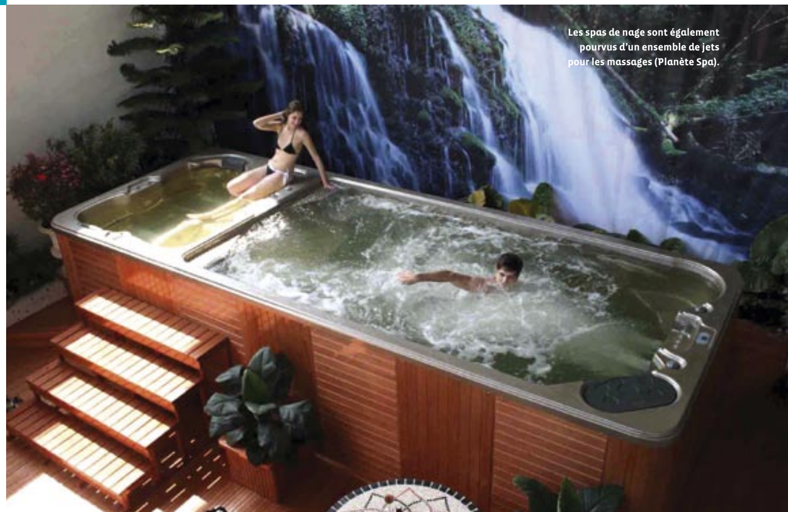
Les spas de nage sont également pourvus d'un ensemble de jets pour les massages (Planète Spa).