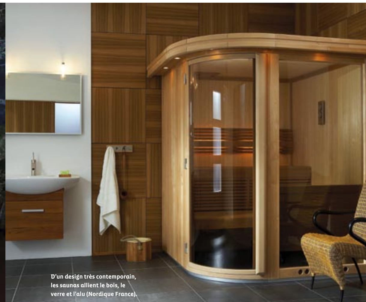
D'un design très contemporain, les saunas allient le bois, le verre et l'aluminium (Nordique France).