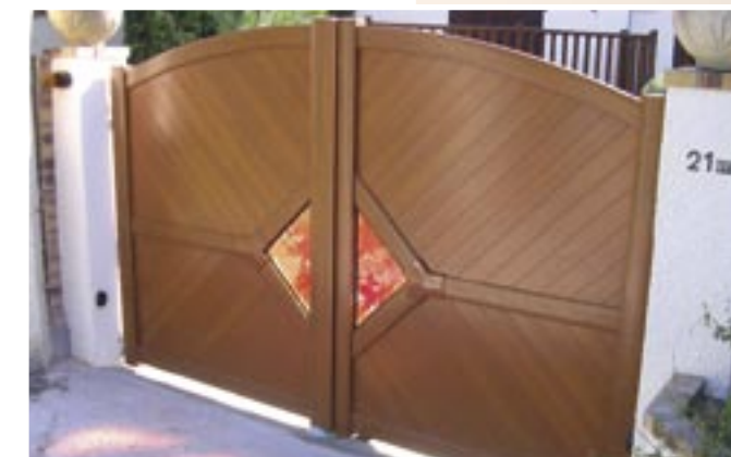
D'aspect bois, ce portail est en fait réalisé entièrement en aluminium ! (Tschoepe)