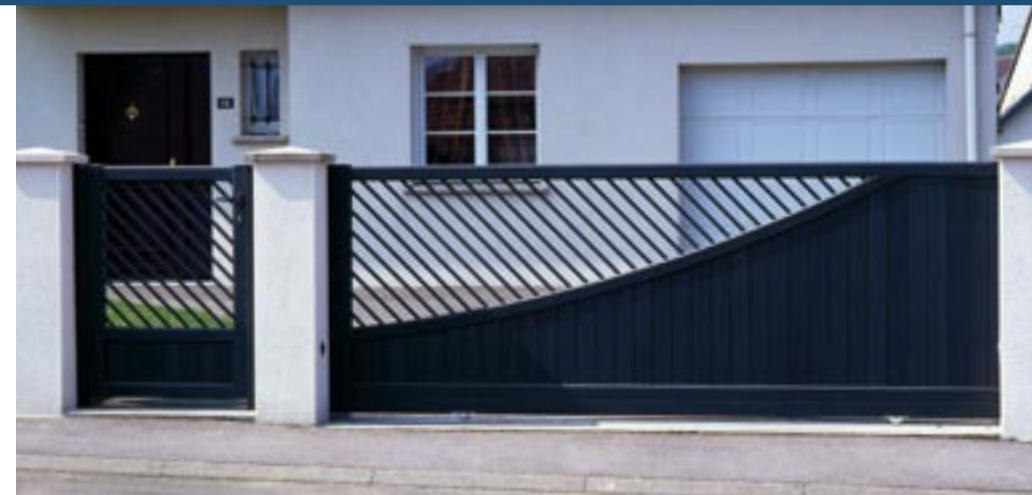
Réalisation : DAR