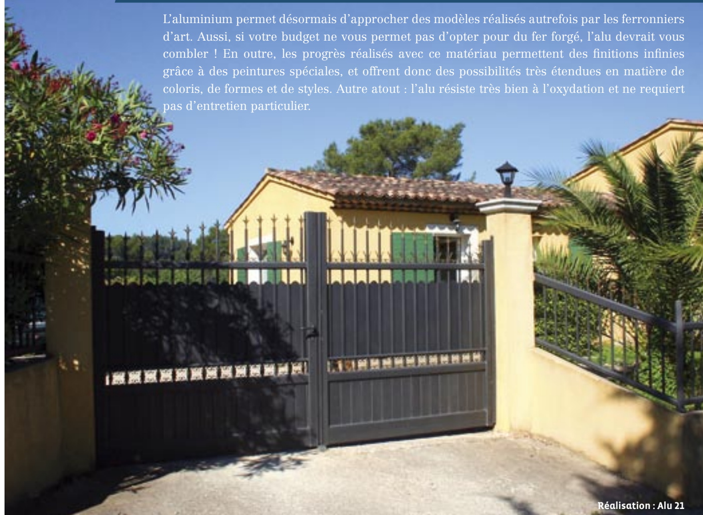
Réalisation : Alu 21

L'aluminium permet désormais d'approcher des modèles réalisés autrefois par les ferronniers d'art. Aussi, si votre budget ne vous permet pas d'opter pour du fer forgé, l'alu devrait vous combler ! En outre, les progrès réalisés avec ce matériau permettent des finitions infinies grâce à des peintures spéciales, et offrent donc des possibilités très étendues en matière de coloris, de formes et de styles. Autre atout : l'alu résiste très bien à l'oxydation et ne requiert pas d'entretien particulier.