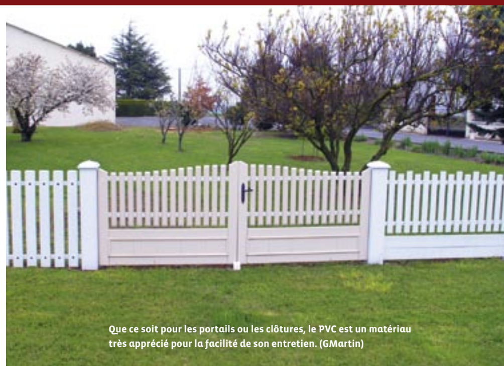
Que ce soit pour les portails ou les clôtures, le PVC est un matériau très apprécié pour la facilité de son entretien.

Résistant aux intempéries et aux amplitudes thermiques, le PVC (littéralement polychlorure de vinyle) est un matériau qui a envahi le domaine de la construction et de la rénovation. Son faible coût et son entretien réduit au strict minimum sont des arguments que les fabricants mettent en avant. Cependant, d'un point de vue esthétique, le PVC reste assez limité. Aussi bien au niveau des fantaisies décoratives que des coloris. En dehors du blanc et du beige, les autres teintes résistent difficilement aux agressions climatiques, notamment aux rayonnements du soleil.