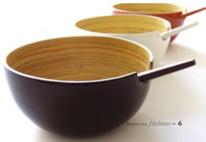
Réussir son Habitat - 6

Un conseil pour vous repérer concernant le mobilier bois : les eco-certifications (FSC et PEFC) commencent à se développer et garantissent que le bois est issu d'une forêt durablement gérée.