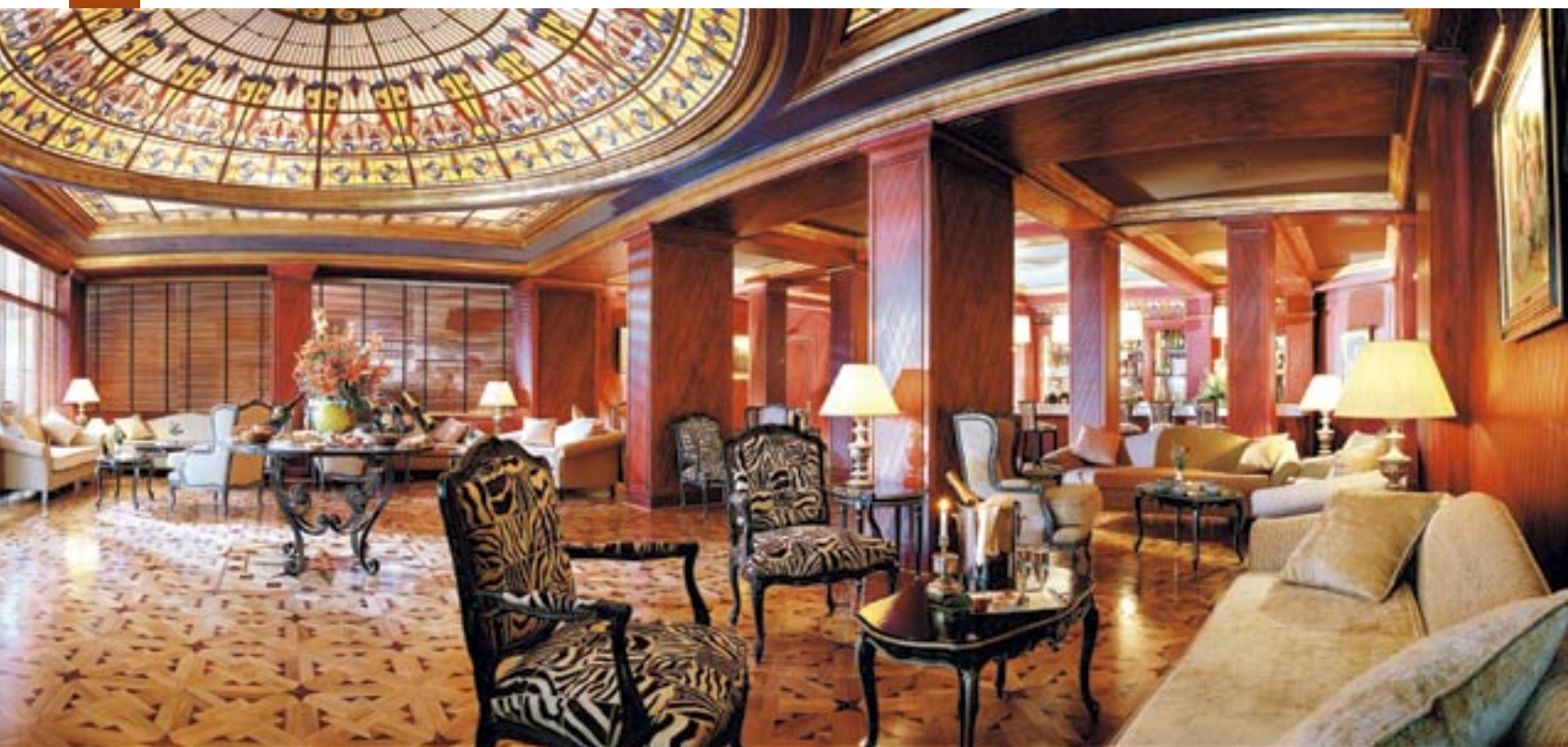
Toutes les techniques et matériaux de l'artisanat marocain semblent s'être donné rendez-vous...