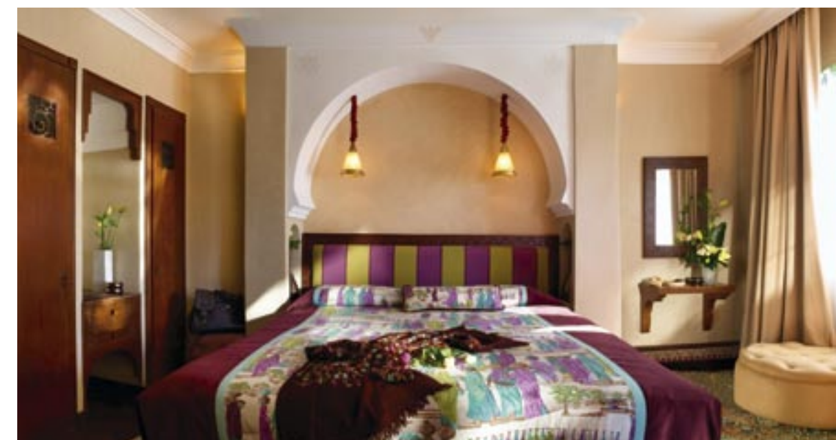
Les suites des Jardins d'Inès ont été décorées avec raffinement dans le style arabo-andalou.