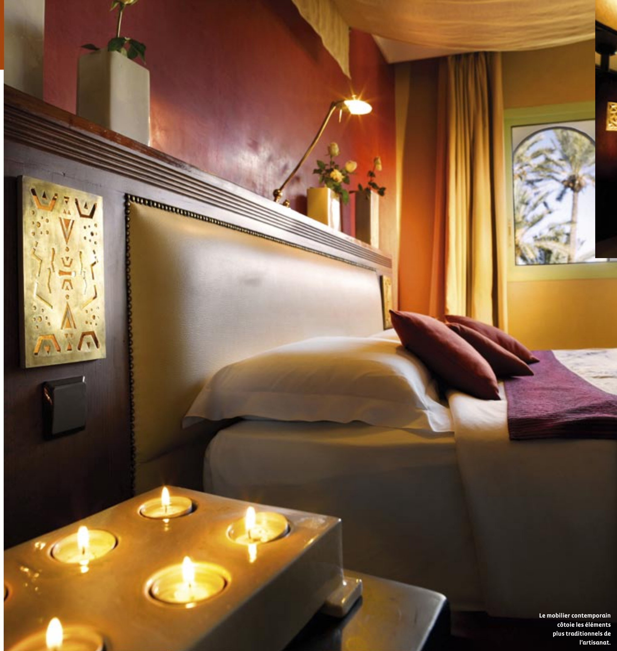
Le mobilier contemporain côtoie les éléments plus traditionnels de l'artisanat.