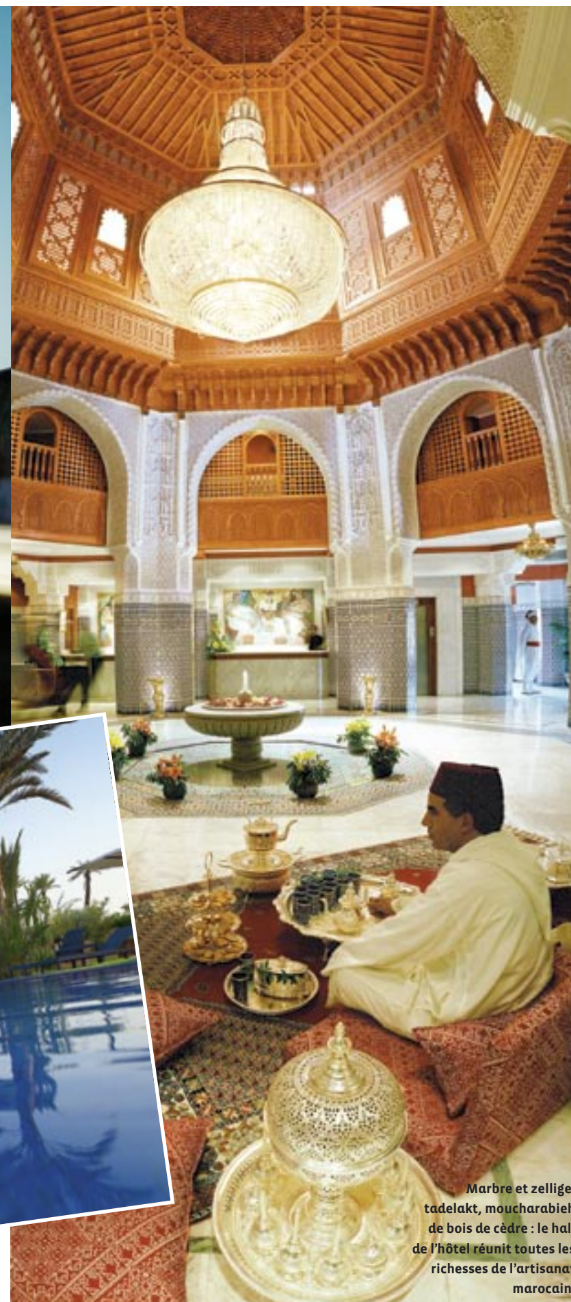
Marbre et zellige, tadelakt, moucharabieh de bois de cèdre : le hall de l'hôtel réunit toutes les richesses de l'artisanat marocain.

LA DÉCORATION DES CHAMBRES CONCILIE LE RAFFINEMENT DE L'ARTISANAT MAROCAIN ET UNE MODERNITÉ PLUS COSY.