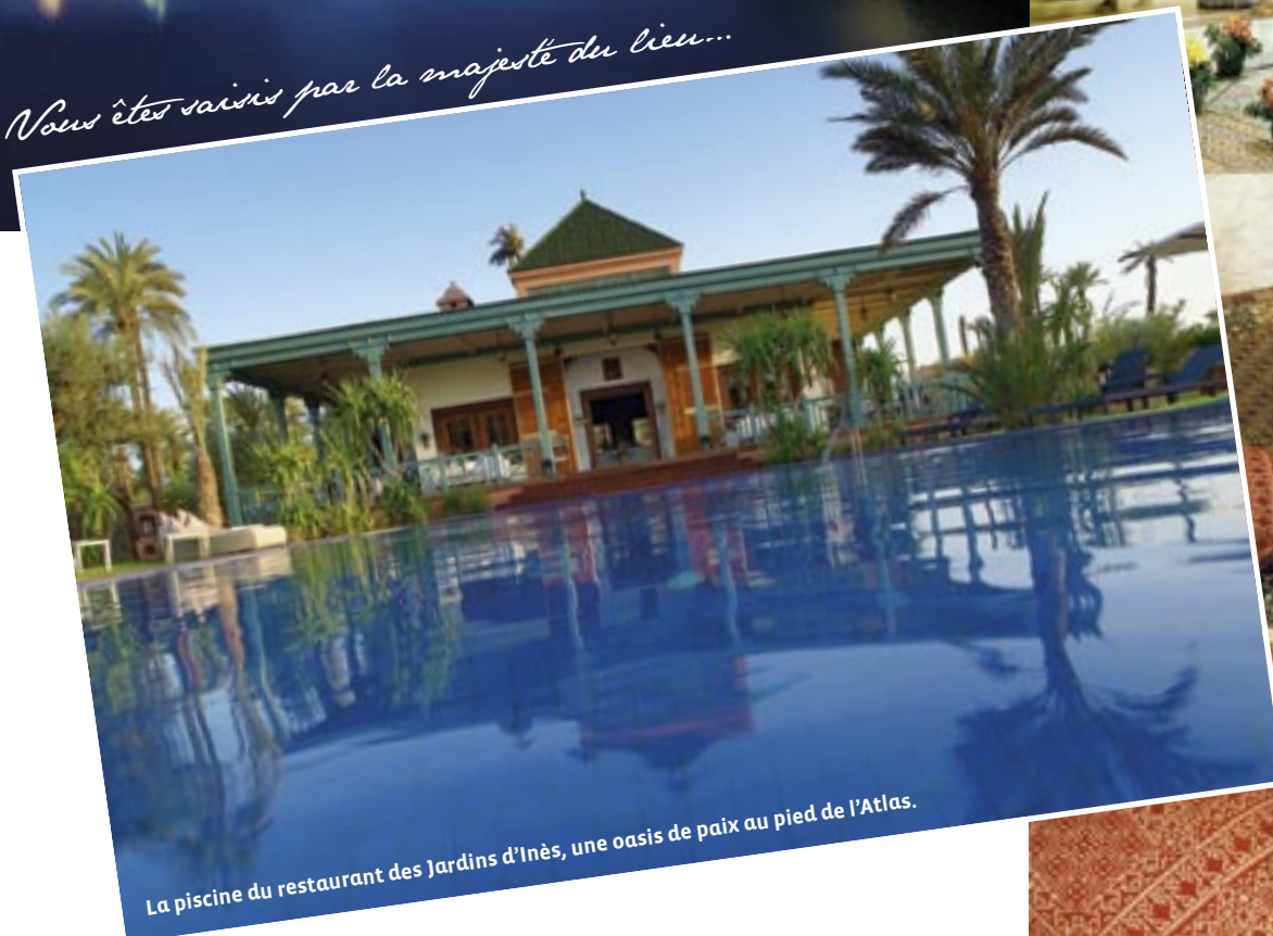
La piscine du restaurant des Jardins d'Inès, une oasis de paix au pied de l'Atlas.