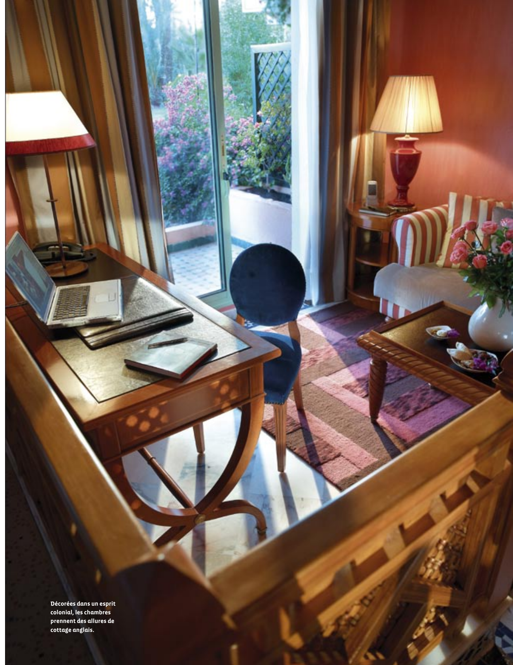
Décorées dans un esprit colonial, les chambres prennent des allures de cottage anglais.