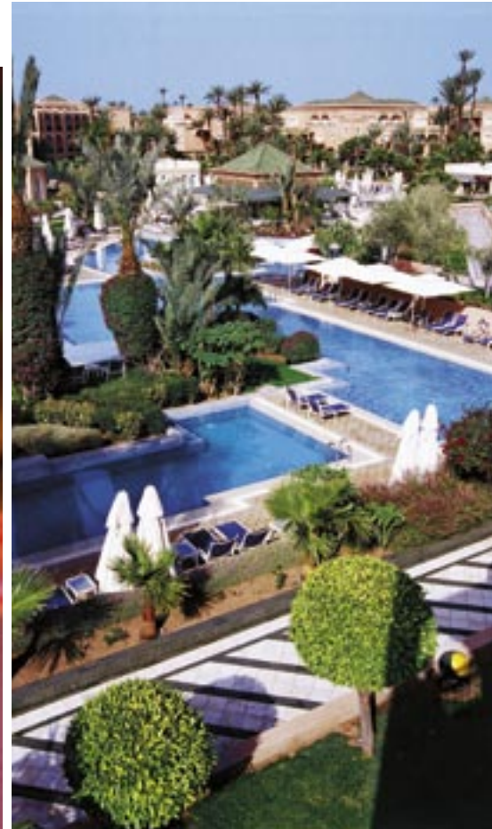
La piscine labyrinthique est une invitation au farniente sous le soleil de Marrakech.