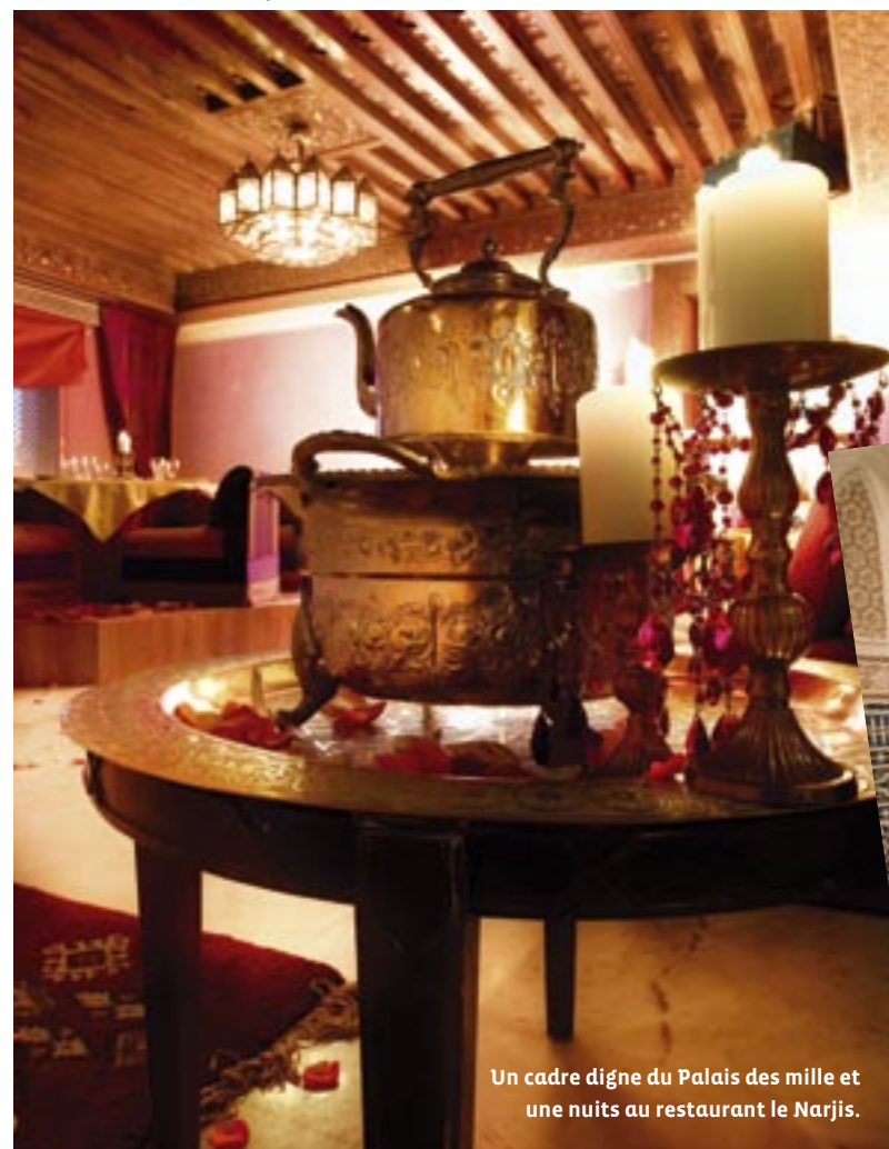
Un cadre digne du Palais des mille et une nuits au restaurant le Narjis.