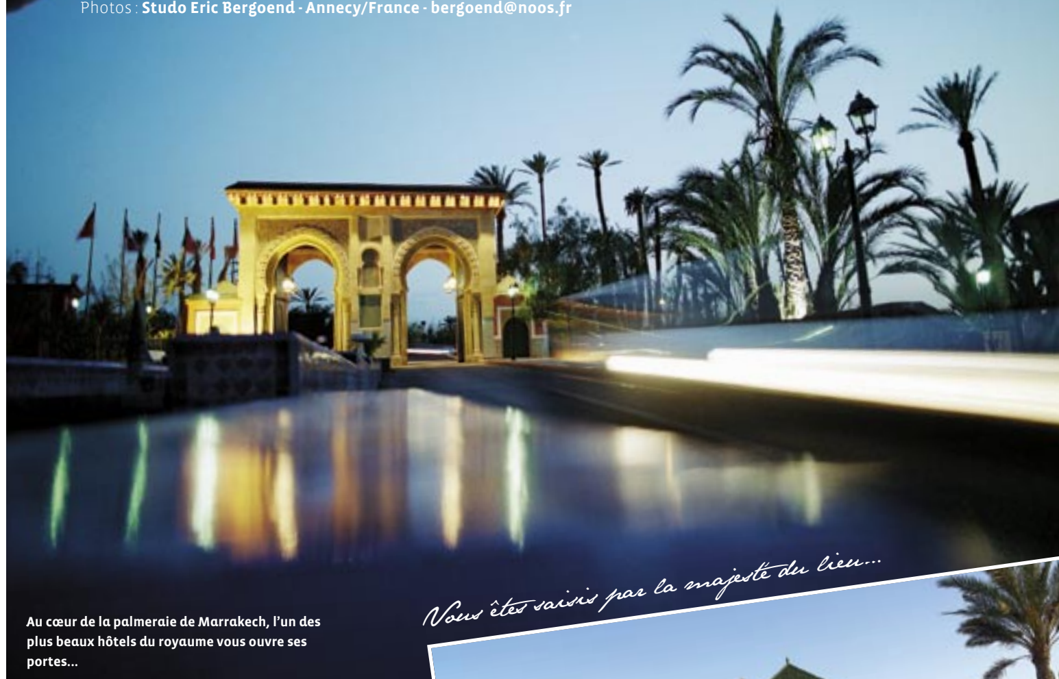
Au cœur de la palmeraie de Marrakech, l'un des plus beaux hôtels du royaume vous ouvre ses portes...