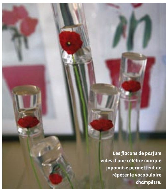
Les flacons de parfum vides d'une célèbre marque japonaise permettent de répéter le vocabulaire champêtre.

Ceux qui étaient trop abîmés ont été simplement recouverts de chaux pour conserver un aspect brut. Le séjour qui donne sur la terrasse a été décoré « à l'anglaise » avec parquet en chêne blond, canapés en tissu fleuri et deux fauteuils tressés en loom pour l'ambiance « garden party ». Les tons choisis sont le beige, le blanc et un jaune coquille d'œuf, avec des touches de