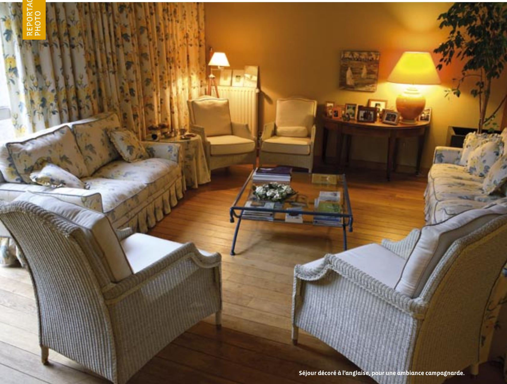
Séjour décoré à l'anglaise, pour une ambiance campagnarde.