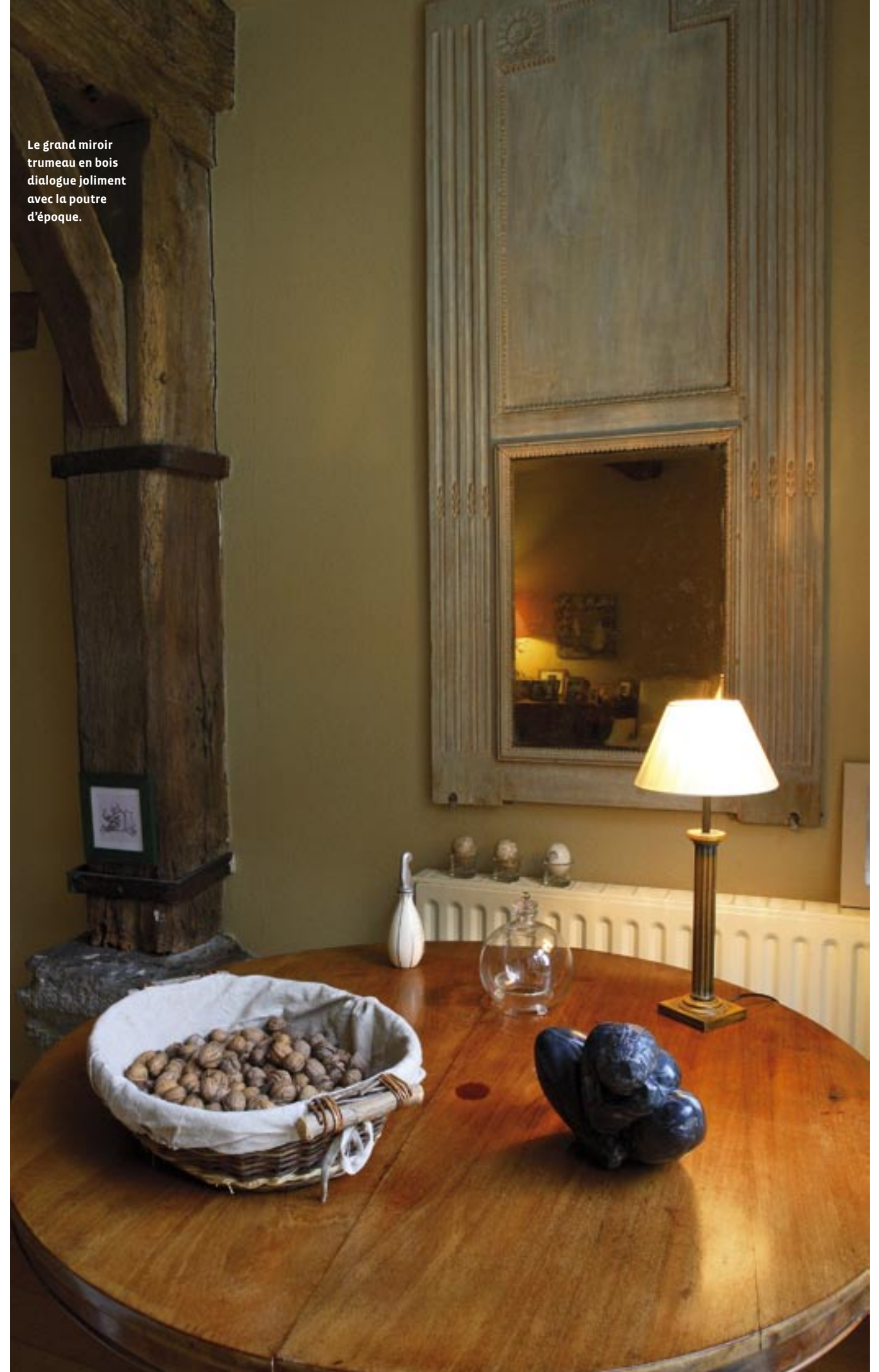
Le grand miroir trumeau en bois dialogue joliment avec la poutre d'époque.

au pied du château médiéval qui fait la fierté des Oudonnais, l'endroit est ensuite devenu un hôtel avant d'être racheté, il y a une vingtaine d'années, pour être rénové en habitation. Les lieux n'avaient pas été habités depuis 15 ans, tous les murs ayant été recouverts de plâtre.