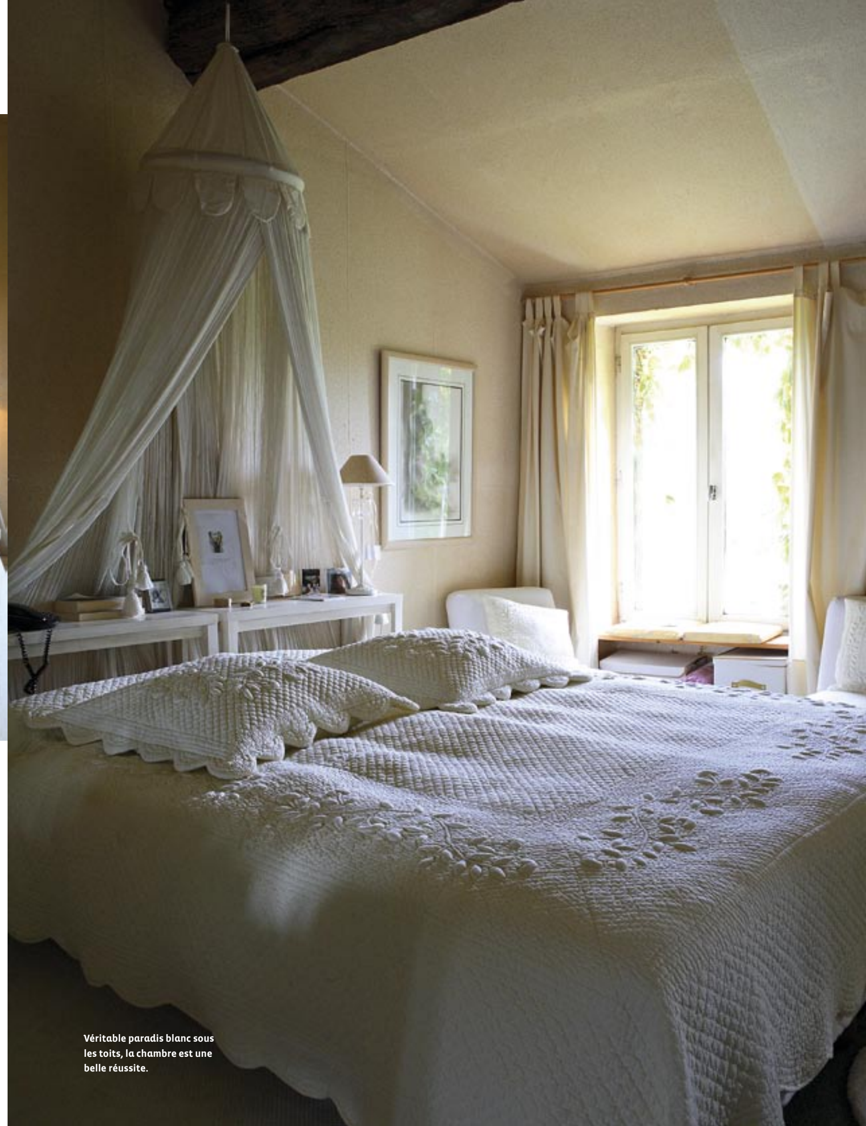
Véritable paradis blanc sous les toits, la chambre est une belle réussite.

bleu pour rappeler celui de la piscine, située à quelques mètres de là. Dans le bureau, la toile tendue couleur tabac met en valeur la superbe cheminée, en tuffeau également. Dans la chambre du second étage nous attend un véritable paradis blanc, romantique et onirique. Le ciel de lit en lin et mousseline et l'épais boutis nous invitent immédiatement à une rêverie prolongée •