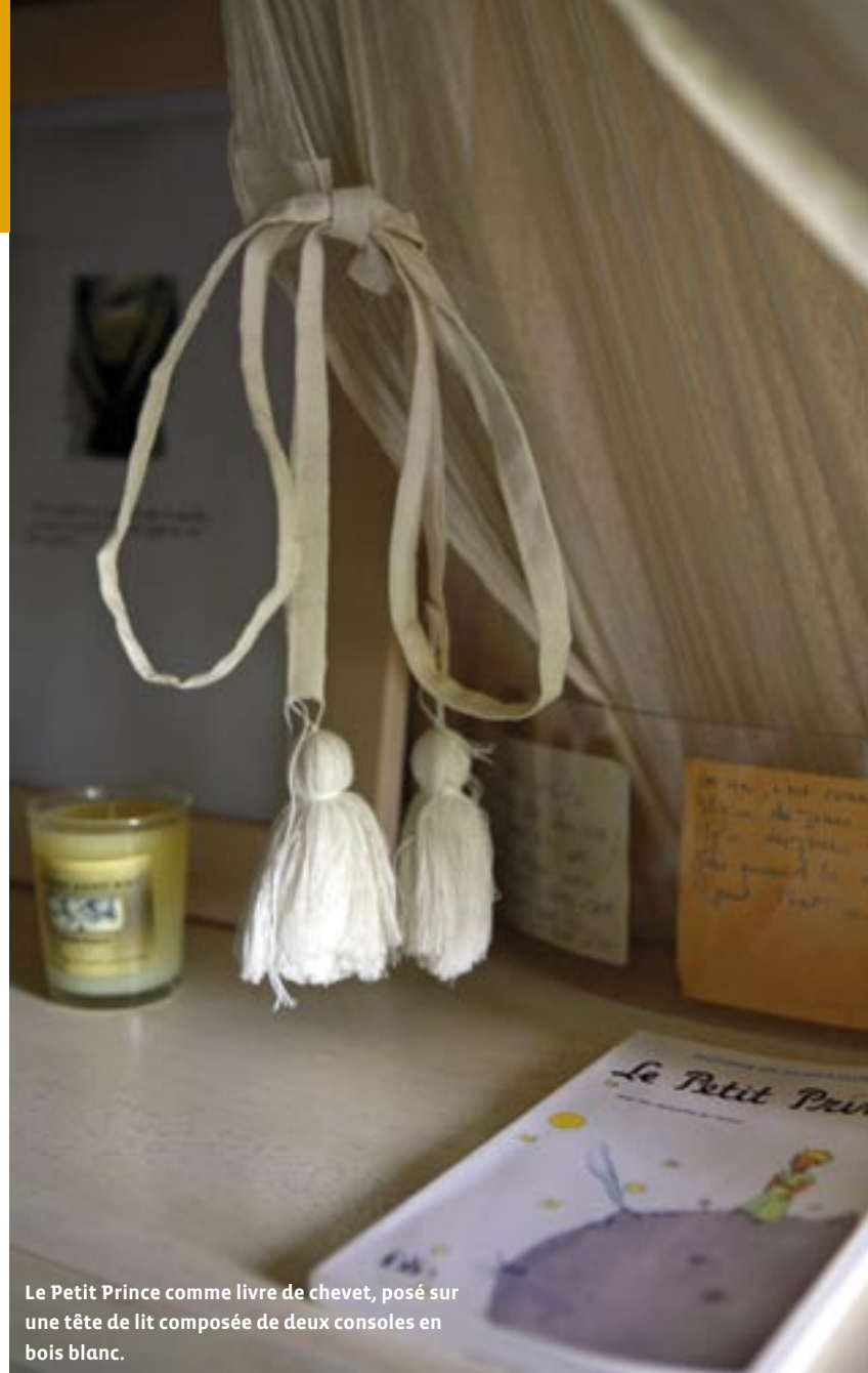
Le Petit Prince comme livre de chevet, posé sur une tête de lit composée de deux consoles en bois blanc.