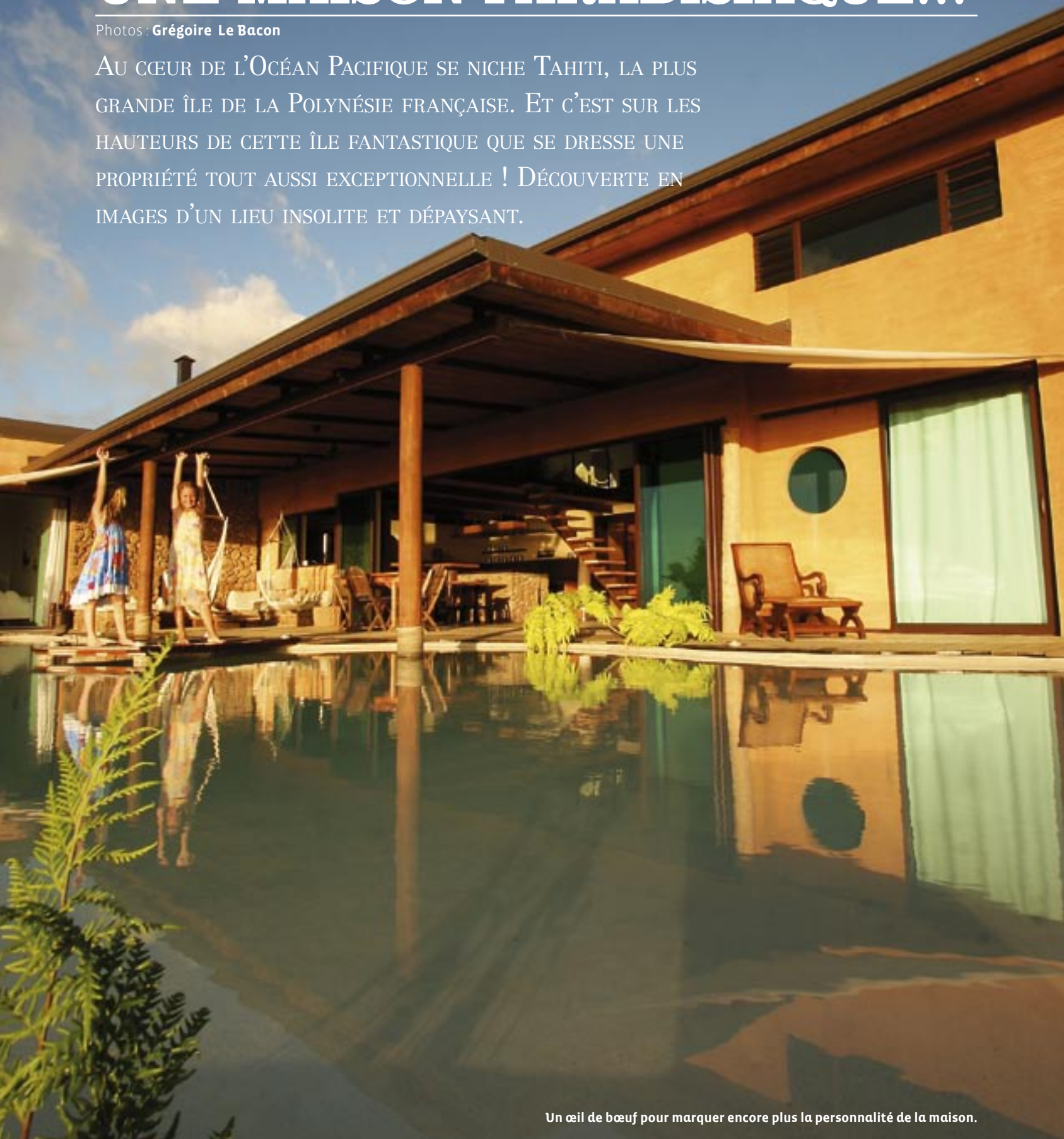
Un œil de bœuf pour marquer encore plus la personnalité de la maison.

AU CŒUR DE L'OCÉAN PACIFIQUE SE NICHE TAHITI, LA PLUS GRANDE ÎLE DE LA POLYNÉSIE FRANÇAISE. ET C'EST SUR LES HAUTEURS DE CETTE ÎLE FANTASTIQUE QUE SE DRESSE UNE PROPRIÉTÉ TOUT AUSSI EXCEPTIONNELLE ! DÉCOUVERTE EN IMAGES D'UN LIEU INSOLITE ET DÉPAYSANT.