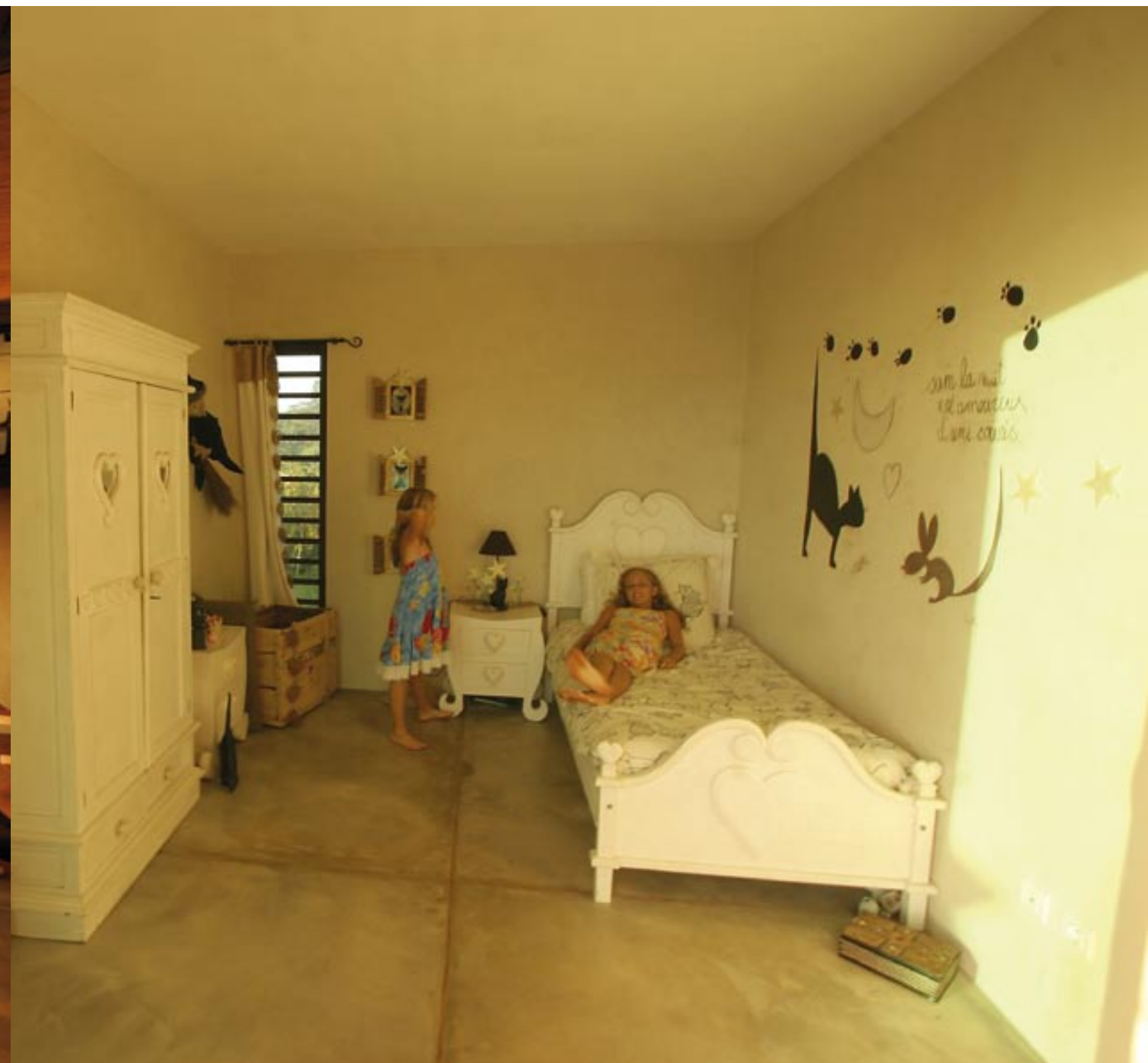
Système favorisant l'aération et la sécurité des chambres d'enfants.

coulissantes design FURIO, réputées pour leurs performances, et utilisées pour les fermetures aluminium de grandes dimensions. Adaptés au neuf comme à la rénovation, ces principes d'ouverture spécifiques à la maison (châssis à galandage sur fenêtres et coulissantes