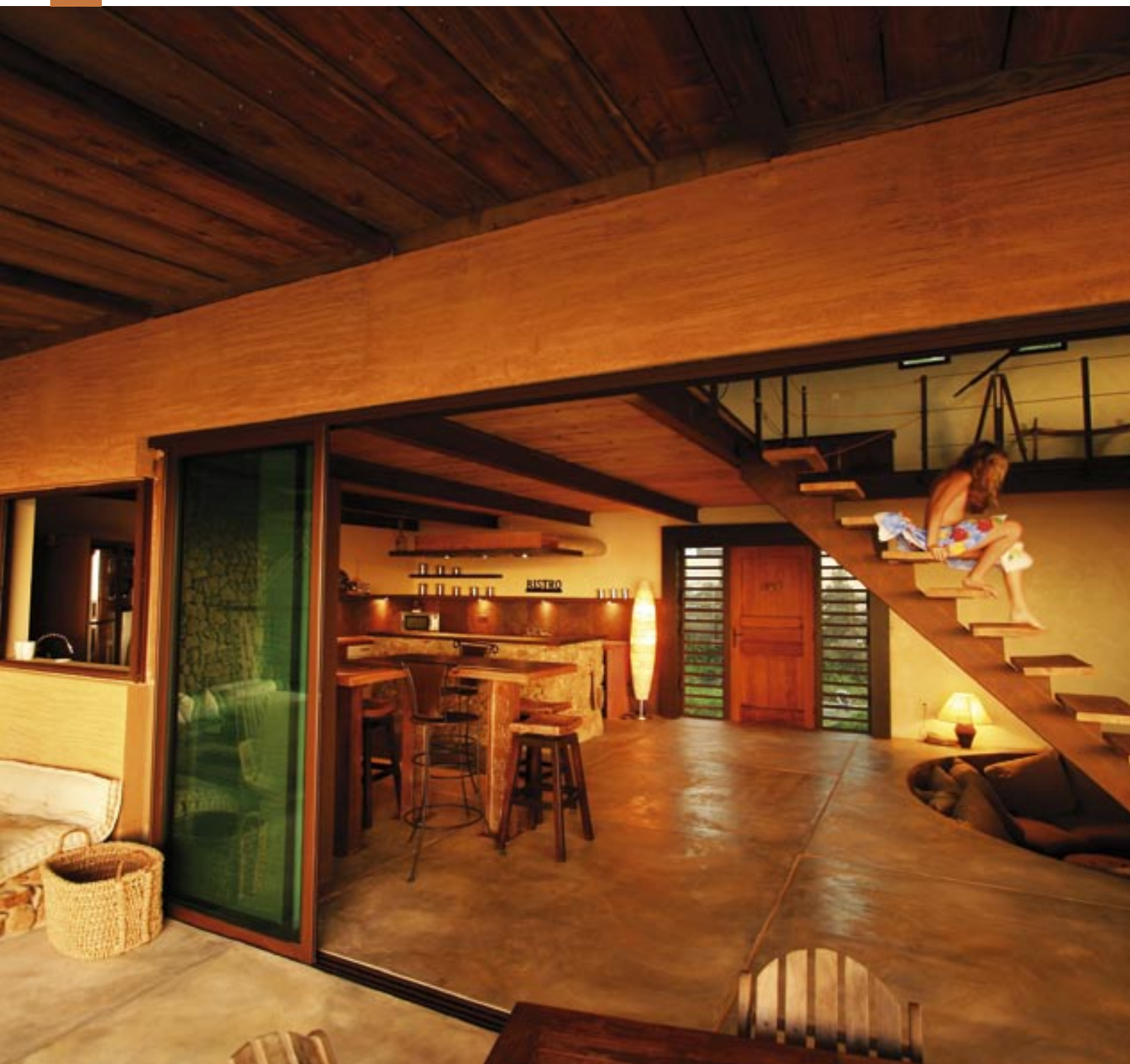
Porte d'entrée avec deux jalousies Trinidad à lames de verre orientables.

associe confort, esthétique et simplicité de montage avec des normes d'étanchéité parfaitement respectées. L'orientation réglable des lames permet de moduler l'aération, en garantissant un maximum de lumière. Autre aspect à retenir : l'intégration de baies