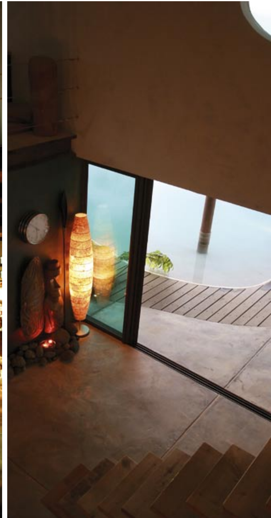
Des lagons parmi les plus limpides du monde...