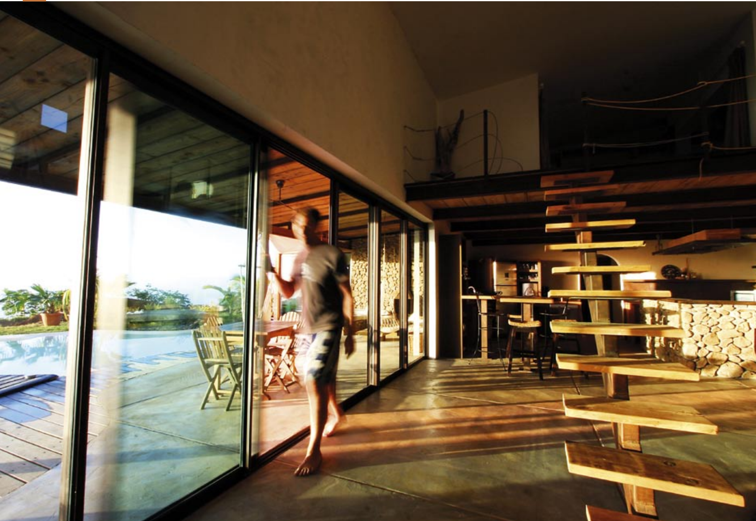
Grand coulissant 6 vantaux 3 rails, à galandage en applique extérieure.