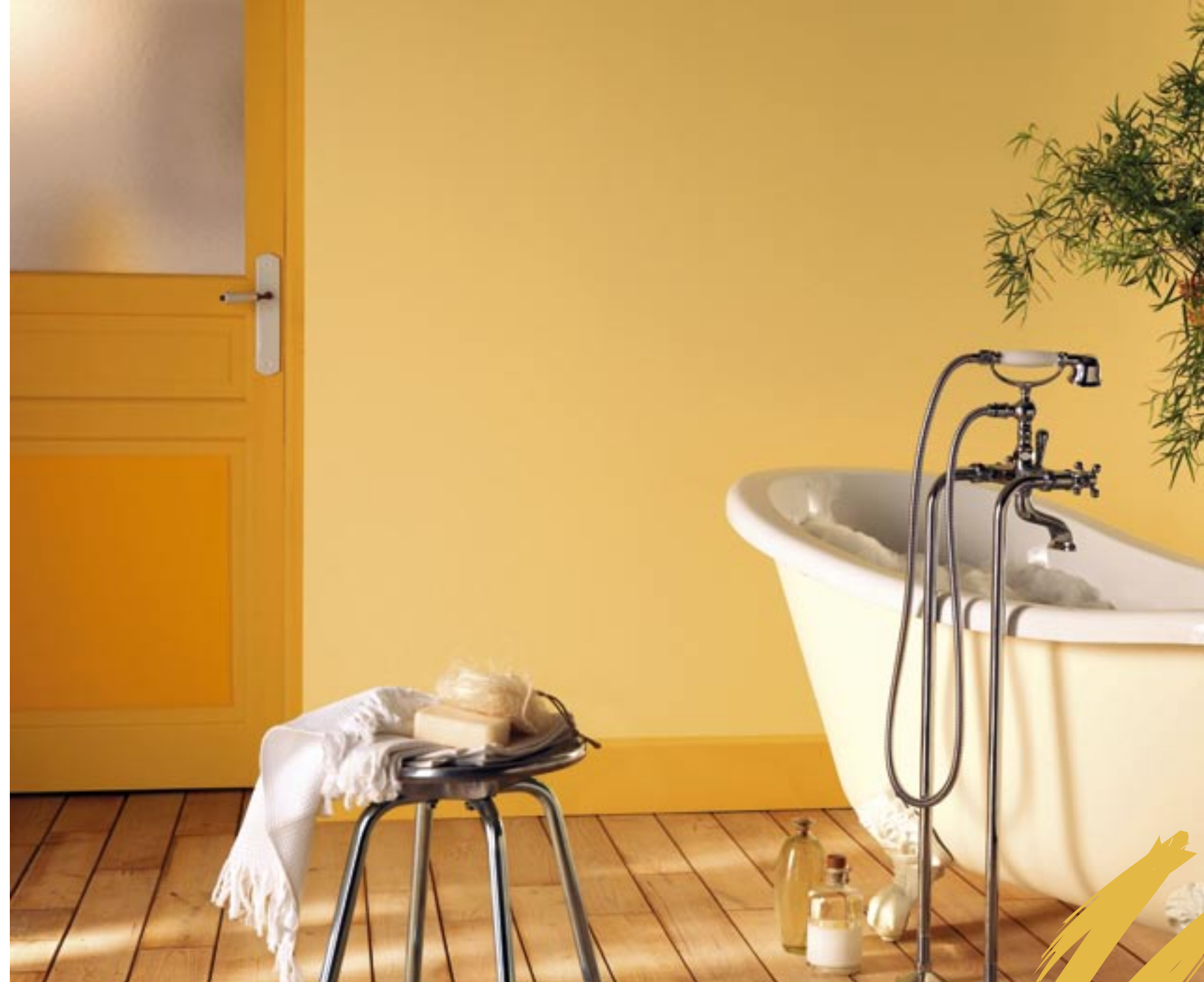
Les peintures murales reviennent en force, pour toutes les pièces de la maison. C'est l'occasion d'en profiter et d'oser toutes vos envies décoratives (V33).

sûre en matière de décoration d'intérieur. La plus remarquée cette saison est en effet un coloris citron vert à la fois doux et apaisant. Cette tonalité subtile s'accorde parfaitement avec les tons pierre, avoine et d'autres teintes plus foncées comme tabac ou chocolat. En plus, cette tonalité vous permettra de créer des décorations murales qui mettront