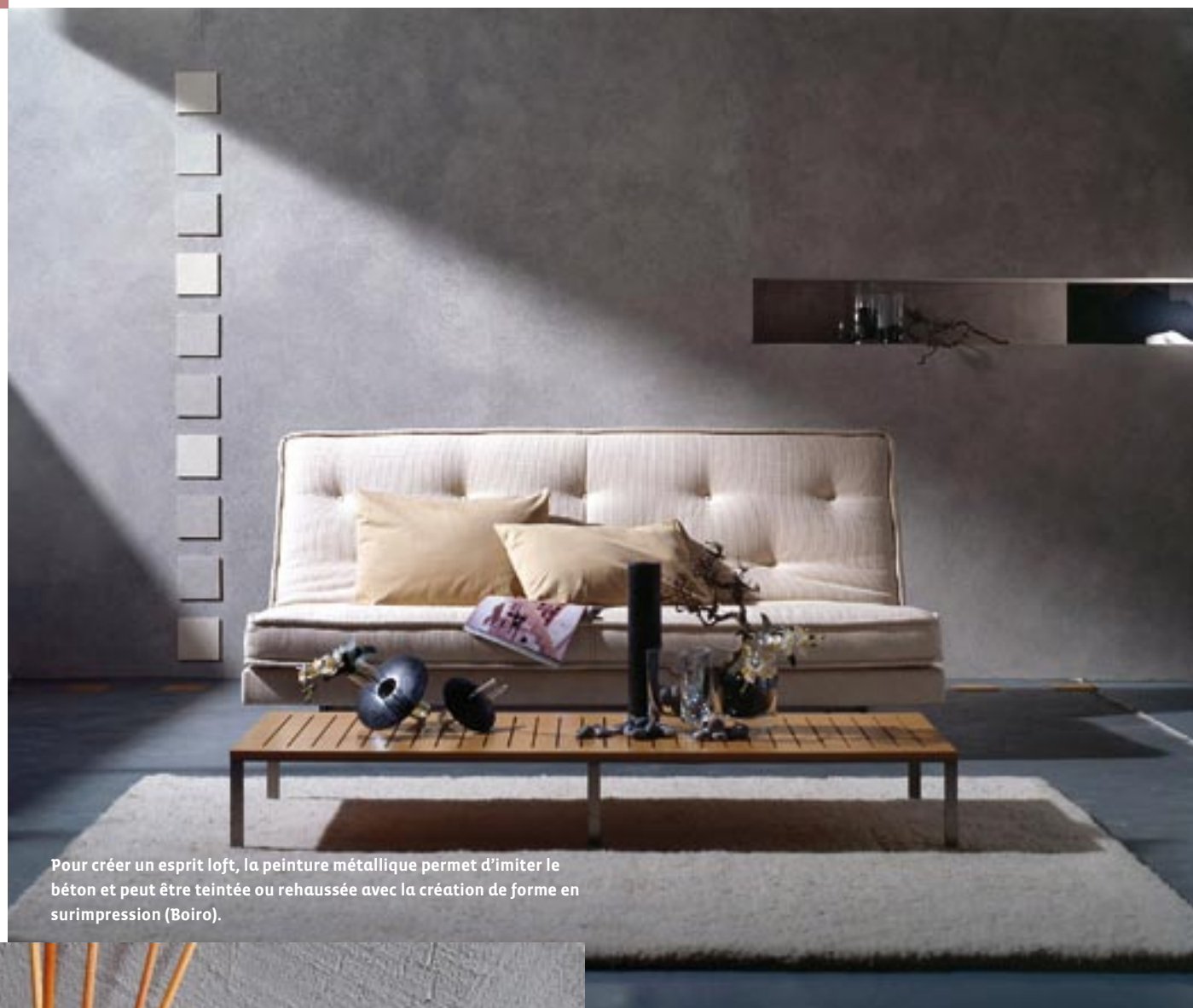
Pour créer un esprit loft, la peinture métallique permet d'imiter le béton et peut être teintée ou rehaussée avec la création de forme en surimpression (Boiro).