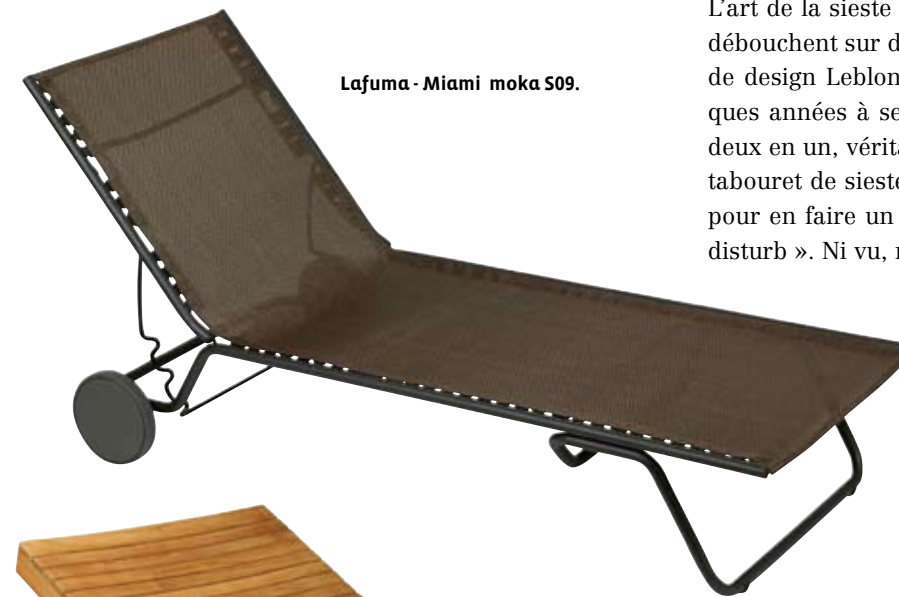
Lafuma - Miami moka 509.

L'art de la sieste se pratique été comme hiver et ses bienfaits reconnus débouchent sur différentes initiatives, notamment au bureau : la société de design Leblon-Delienne par exemple autorise la sieste depuis quelques années à ses salariés. Sinon, vous pouvez opter pour des assises deux en un, véritable invitation à faire la sieste. Matali Crasset avec son tabouret de sieste « Téo de 2 à 3 » a imaginé un siège que l'on déroule pour en faire un matelas et dont l'assise devient un panneau « Do not disturb ». Ni vu, ni connu, on fait une sieste pleinement assumée !