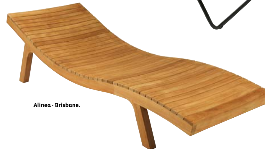
Alinea - Brisbane.