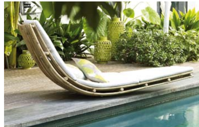
Alinea - Muong.

des paresseuses aux éditions Marabout par exemple ! Enfin, loin du traditionnel transat en bois, en toile unie ou bayadères, on la pratique aujourd'hui dans des assises d'un nouveau genre : bains de soleil en résine, loungers XXL, hamacs autoportants ou banquettes d'intérieur sortie à l'extérieur.