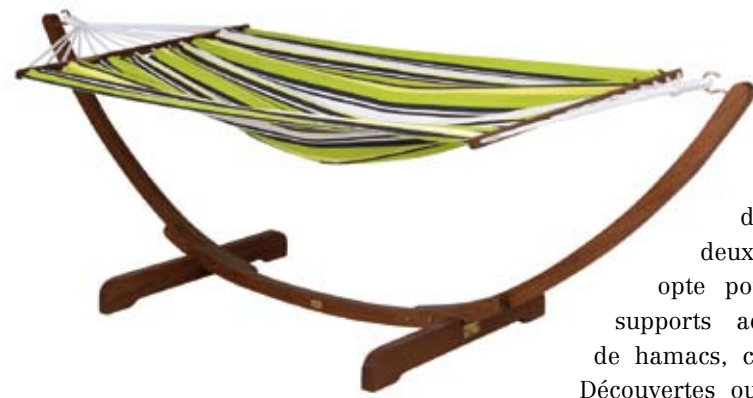
Alinea - Bird-hamac.

position idéale car il ne repose pas sur une surface dure. On le fixe entre deux arbres, ou bien on opte pour des modèles avec supports adaptés à tous types de hamacs, comme chez Nature et Découvertes ou Alinéa. Cantonné au jardin comme lit d'extérieur, le hamac fait son entrée à l'intérieur, notamment dans les chambres d'adolescents qui apprécient son côté « routard » et décontracté. Autre possibilité : sortir