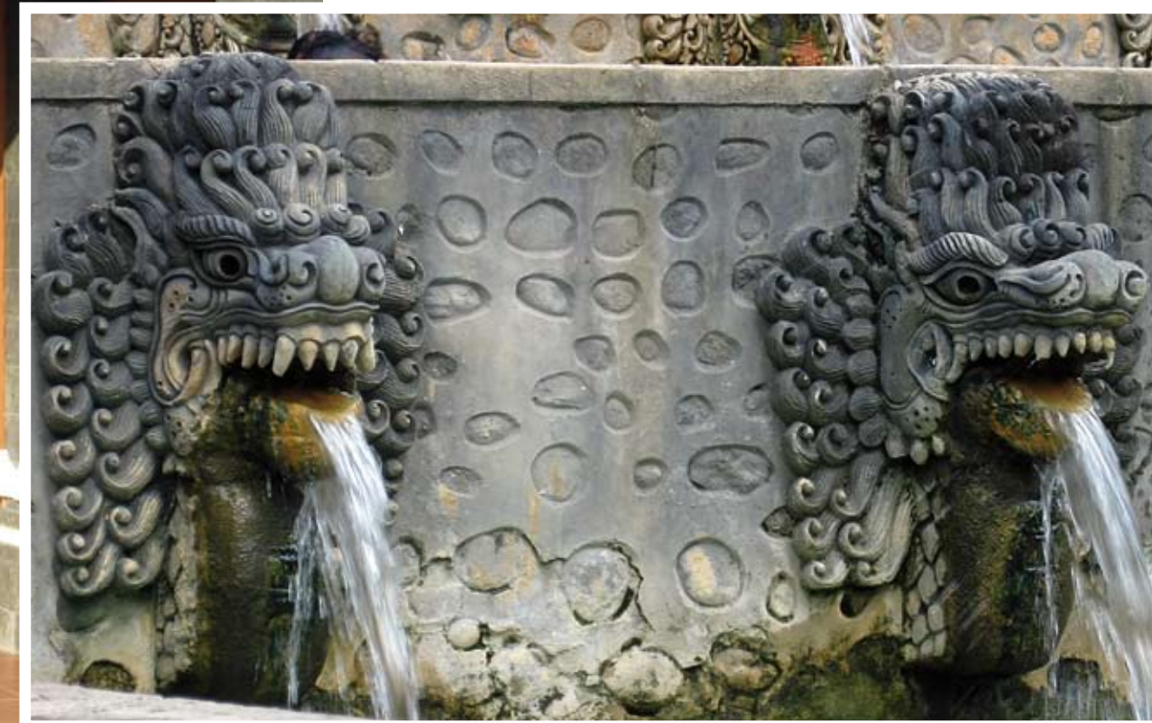
Des fontaines pour un peu de fraîcheur.