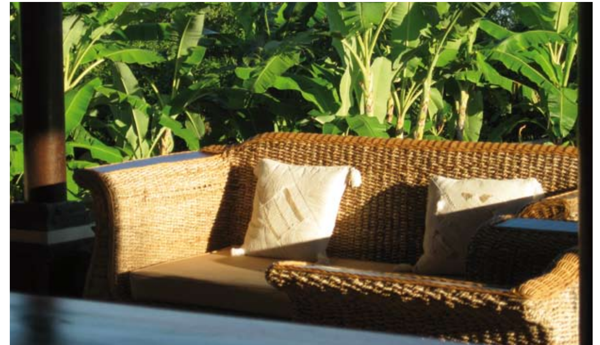
Un sofa abrité pour se protéger des rayons du soleil.

A proximité de la piscine un « gazebo », petit pavillon traditionnel à quatre piliers de bois, ouvert sur l'extérieur, clos de légers rideaux de cotonnade, invite à la détente.