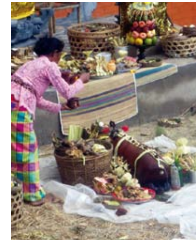
Au choix repas traditionnel ou repas européen.