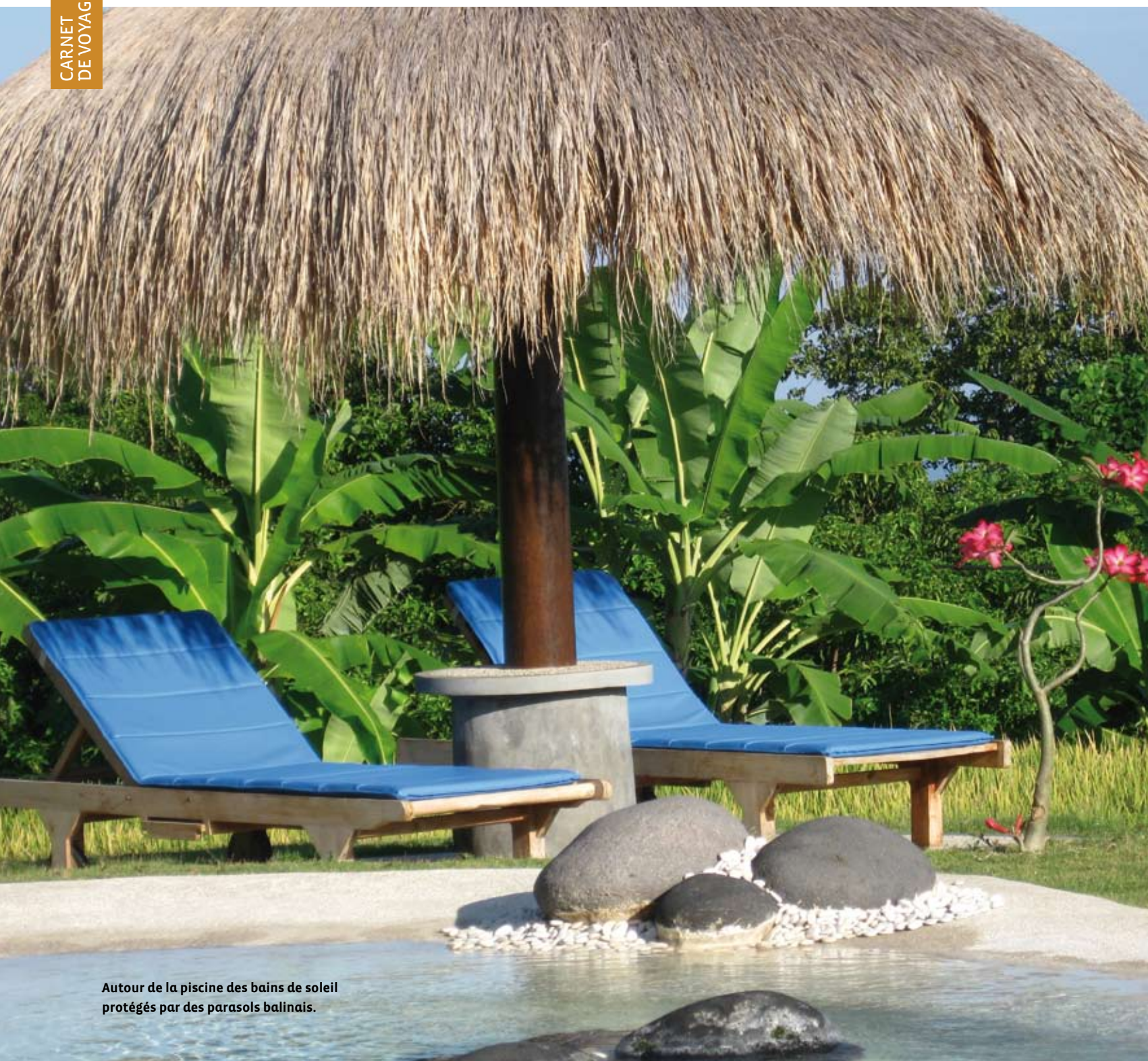
Autour de la piscine des bains de soleil protégés par des parasols balinais.